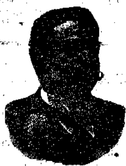
(Marca di Fabbrica Depositata)