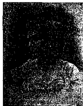
(La soprano Fausta Labia)

La melodiosa aria di Elisabetta nella prima scena, rivale subito il ben noto valore della signora Fausta Labia.