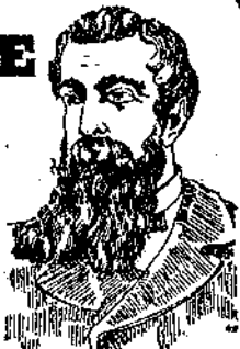
PRIMA DELLA CURA