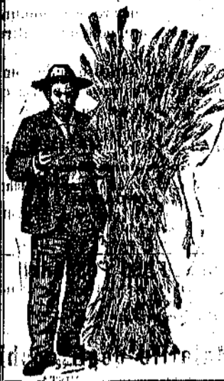
F. FRATELLI INGEGNERI - MILANO

Il Frumento merita elogi per la sua particolare bellezza e copiosità di grano che produce fruttifero, a 35 spighe per ogni grano. Resiste all'allettamento, alla nebbia ed alla ruggine. Resiste a venti forti, non presenta ruggine.