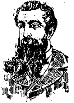
DOPO LA CURA