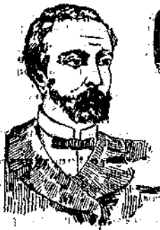
PRIMA DELLA CURA

Deposito generale da A. MIGONE e C., Via Torino, 12, MILANO. - Alle applicazioni per pacco postale aggiungere cent. 50.