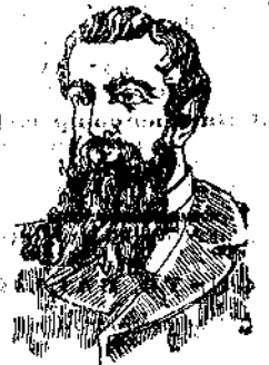
DOPO LA CURA