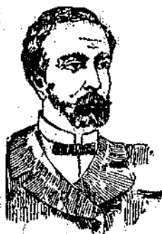
PRIMA DELLA CURA