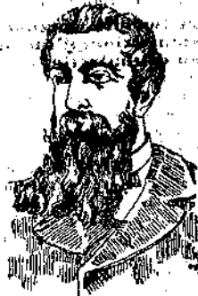
DOPO LA CURA