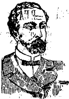
PRIMA DELLA CURA

Alle spedizioni per pacco postale aggiungersi centesimi 80.