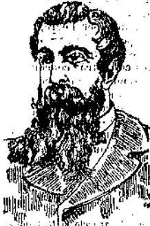
DOPO LA CURA