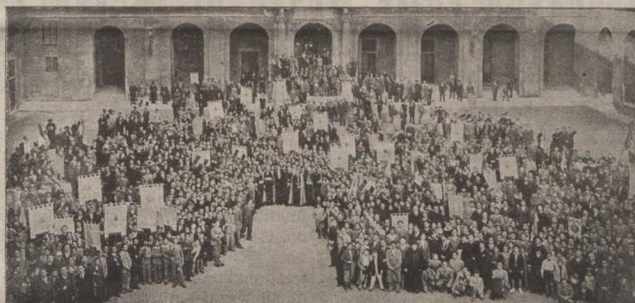
I Settimanalisti - Roma 1-4 novembre

Non so quante fossero le bandiere portate dalle associazioni intervenute: certo molte e su per la Scala Regia ac-