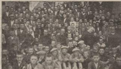
Convegno Sottofederale Aspiranti a Sedegliano