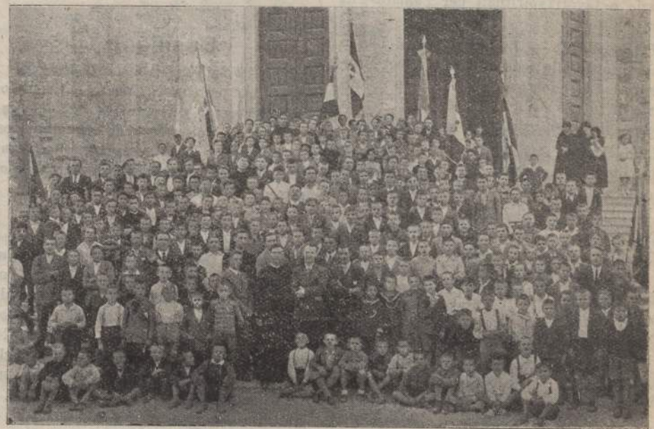
Convegno sottof. Aspiranti a Mortegliano

Nella nuova e bella sala del Ricreatorio abbiamo veduto circa 250 pinucci ascoltare il saluto cordiale del Presidente dell'Ass. Giov. di Rive d'Arcano, il saluto in poesia