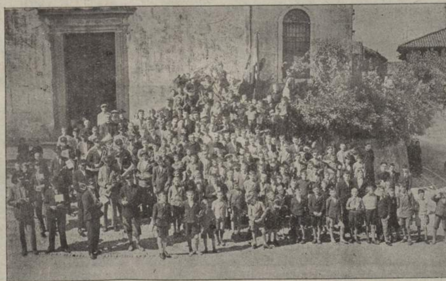
Convegno sottof. Aspiranti a Rivignano