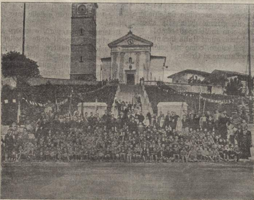
Convegno sottof. Aspiranti a Rive d'Arcano

ASPIRANTI IN GITA. — Venerdì 13 settembre, in numero di 25 i nostri bravi Aspiranti sotto la solerte guida dell'Ass.