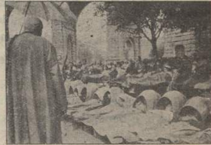
La Benedizione col SS.mo agli ammalati

Erano alcuni ricordi di Lourdes che essi avevano comperato per i loro