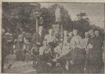
Il Gruppo dei nostri Giovani « sani » ed « ammalati » ai piedi dell'Immacolata

A Grenoble, in una sosta dei due treni « Frassati » e « Matthey » cantammo con passione lì, sotto le luci della stazione, l'inno a Roma. Fosse l'effetto delle virtù canore, fosse la simpatia latina, fatto sta che i fran-