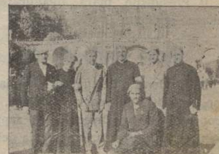
Con l'Assistente Eccl. Centrale