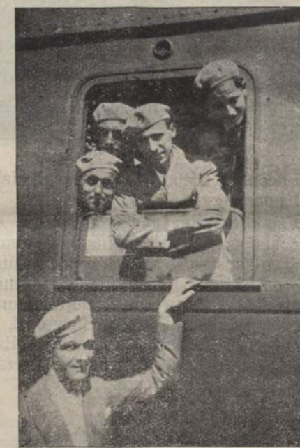
L'addio a Lourdes