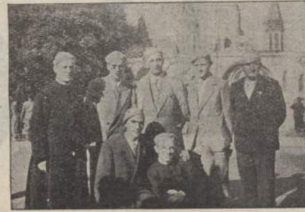
I nostri Giovani col Presidente Centrale