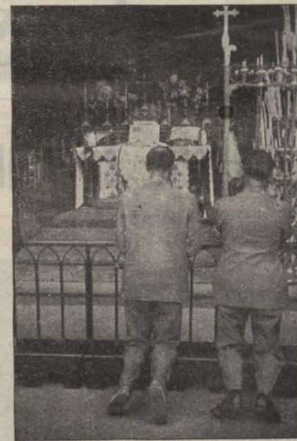
Il Presidente Diocesano in preghiera dinanzi alla Grotta