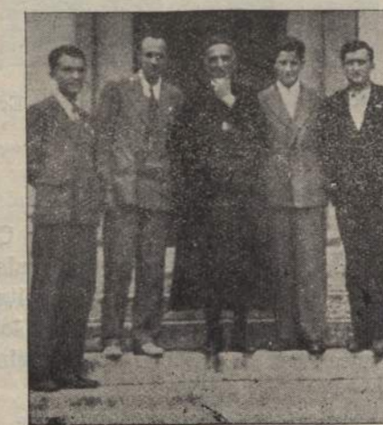
A Milano ospiti del carissimo Padre Pio Gabos