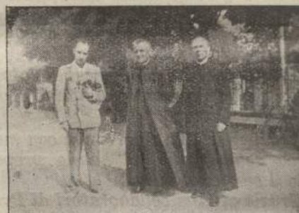
I tre Comandanti