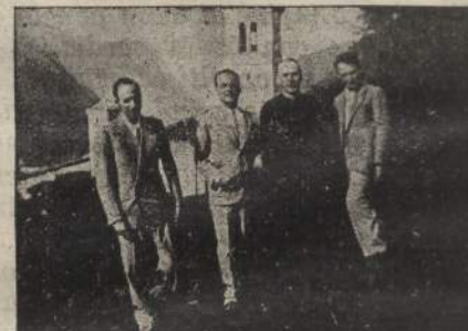
I Dirigenti della Gioventù e degli Uomini Cattolici