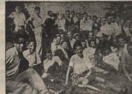
Un gruppo di Settimanalisti