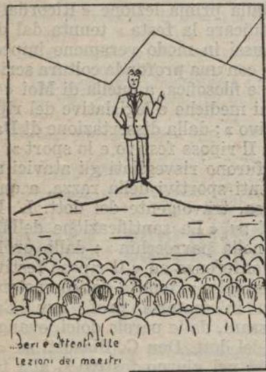
«seri e attenti alle lezioni dei maestri».

Erano allegri, birichini, ma tutti, quando lo si richiedeva, «seri ed attenti alle lezioni».