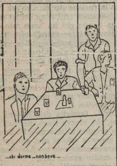
«chi dorme... non beve».

Ma perchè, in refettorio, tutti divoravano le pietanze con estrema rapidità? Perchè tutti davano, in giro, in giro e al vino, delle guardinghe occhiate? Chiedetelo ai settimanalisti e vi risponderanno: «Chi dorme... non beve!».