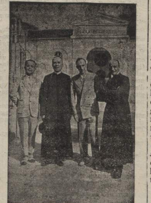
Intima unione tra Sacerdoti e Dirigenti

Ti potrei rispondere col proverbio che conosci meglio di me: « Chi ha tempo non aspetti tempo ». Quanti con questa scusa han rimandato di anno in anno e poi non li poterono fare! Non vedi che la vita umana ha la durata di un fiore? Non conosci anche tu tanti tuoi compagni che sono morti più giovani di te? Non credere che il pensare alla morte la faccia venire più presto ovvero il non pen-