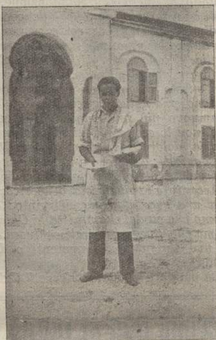
Il Presidente Sottofederale di Moggio elegante cameriere dei settimanalisti