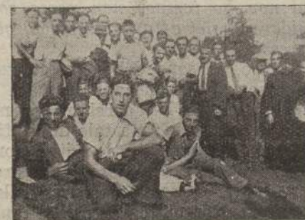
Altro gruppo di Settimanalisti