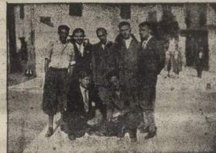
Il Presidente Federale coi collaboratori