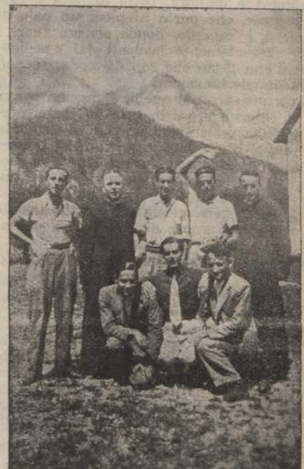
Il Clero coi Fucini vita e gioia della Settimana di Moggio

La grande malattia dell'età moderna, fonte precipua dei mali che tutti deploriamo, è la mancanza di riflessione, quell'effusione continua e veramente febbrile alle cose esterne, quell'immoderata appetenza delle ricchezze e dei piaceri, che a poco a poco affievolisce negli animi ogni più nobile ideale, li immerge nelle cose terrene e transitorie e non permette loro di assurgere alla considerazione delle verità eterne, delle leggi divine, di Dio, unica fonte di tutto ciò che esiste, unico fine dell'universo creato, il quale nella sua infinita bontà e misericordia, ai di nostri, con effusione straordinaria di grazie, potentemente attira a sé le anime, non ostante la corruzione che dappertutto s'infiltra.