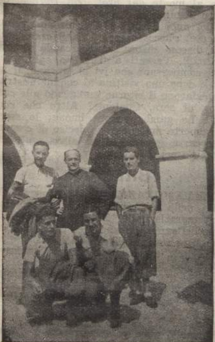
Un gruppo di Fucini Settimanalisti