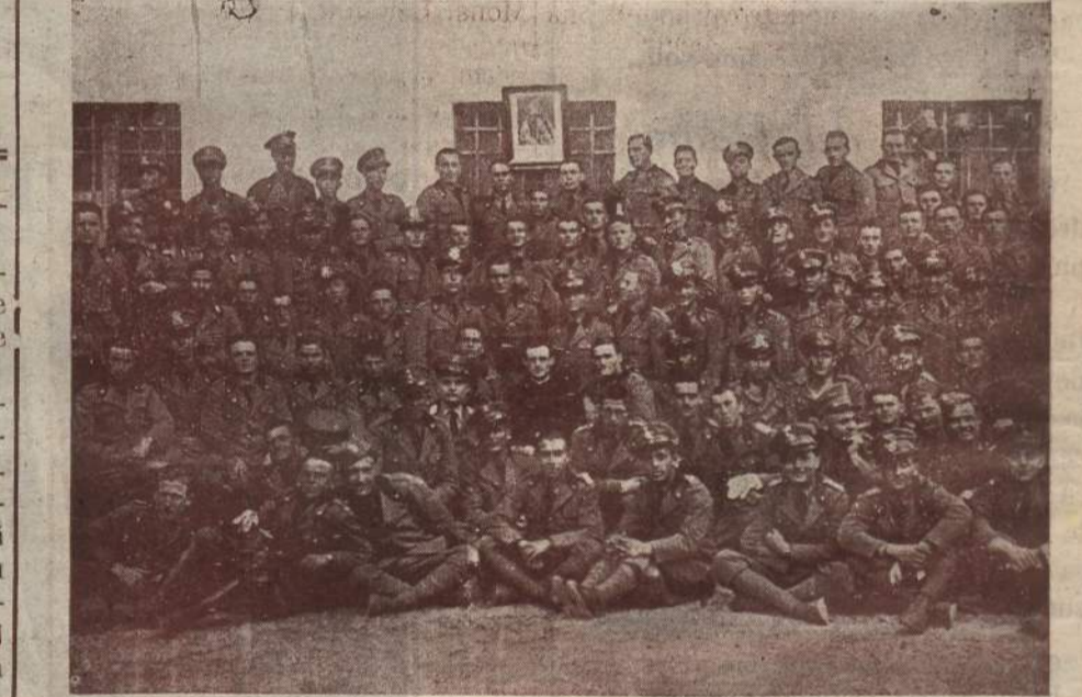
Ritrovo Militare « Milites Mariani » B. V. delle Grazie - Udine Festa delle reclute - 12 maggio 1935