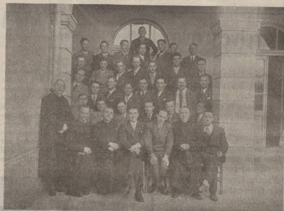
I partecipanti al Consiglio Federale

Dopo il pranzo in comune, consumato nell'ospitale Casa dei PP. Lazzaristi, i convenuti si sono portati alla Casa dell'Azione Cattolica per la seduta.