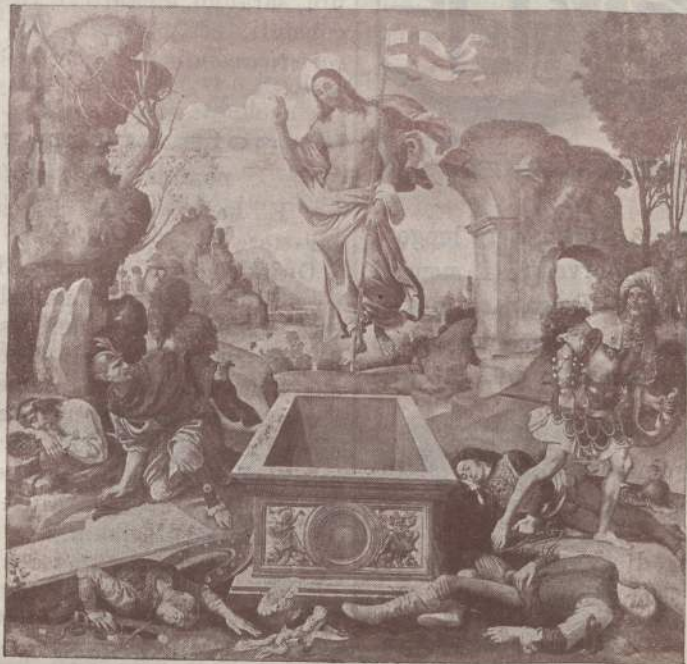
Era l'alba; e molli il viso, Maddalena e l'altre donne fecan lamento sull'Ucciso; ecco tutta di Sionne si commosse la pendice, e la scolta insultatrice di spavento tramortì.

«Io sono il buon pastore. Il buon pastore dà la sua vita per le sue pecorelle e io dò la mia vita per le mie pecorelle. Ed ho altre pecorelle che non sono di questo gregge; anche vedendo, attraverso i secoli, un gregge sterminato di pecorelle amate andare verso di Lui, così disse: