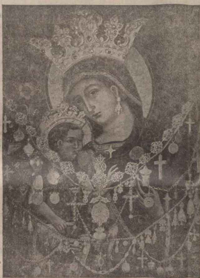
AVE, O MARIA, PIENA DI GRAZIA