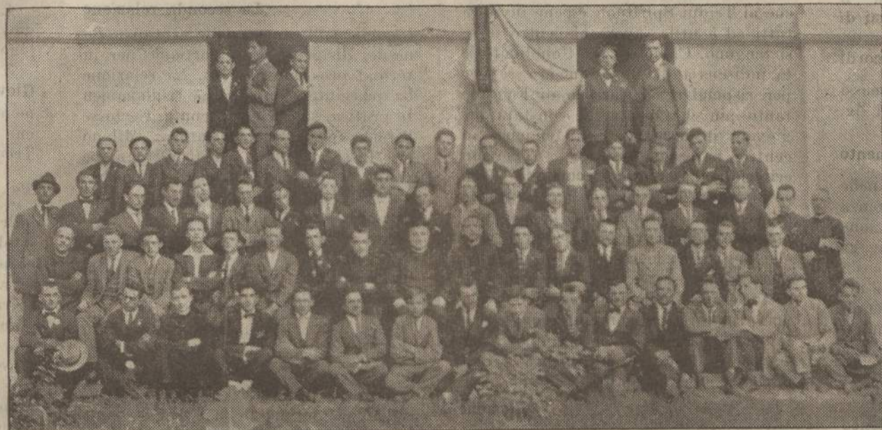
I pionieri degli Esercizi chiusi promossi dalla Federazione