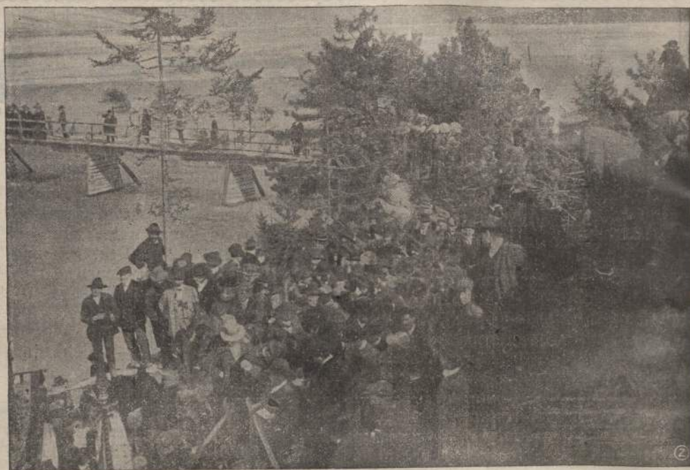
Posa della prima pietra del nuovo Ponte di Davons

vittoriosa la sfida al tempo perverso, alle fatiche, ai disagi del lavoro. Il Tagliamento con le sue più ampie ghiaie non reca più timore, poichè sulle pile costruite con carnica costanza si adagerà ben presto il ponte intero, indice di conseguita civiltà dei comuni congiunti. Termina con un monito e un augurio: ogni operaio si consideri parte e tutto dal