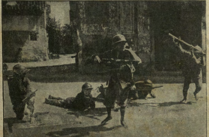
La parodia della guerra. I piccoli del Friuli, canuffati da veri e propri combattenti si divertono a mondo, mettendo così in ridicolo l'insensata opera attuale dei grand.