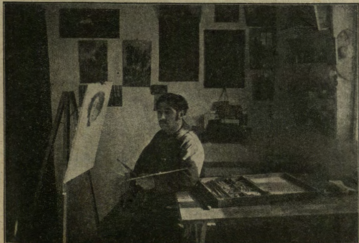
Sigmundsherberg, campo di concentramento dei prigionieri di guerra italiani. Un artista che lavora nel suo „atelier“.