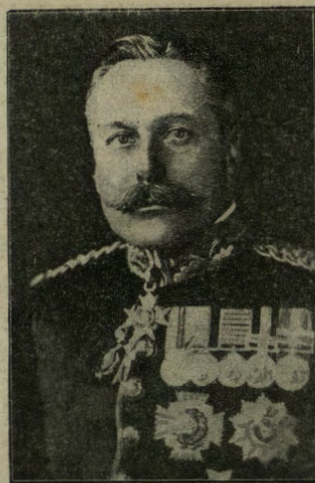
Il maresciallo Sir Douglas Haig, uno dei nomi sui quali spera l'Inghilterra.

Per esempio: proiettili di cera, di carta, di burro, perfino di acqua. Contrariamente però a quanto si potrebbe credere, tali proiettili sono capaci di produrre ef-