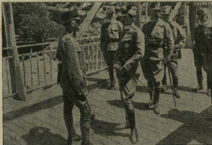
L'eccessiva modestia dell'imperatore e re Carlo I. Il giovane Monarca recatosi, alla frontiera svizzera col suo Stato Maggiore, s'incontra con un ufficiale della Confederazione a cui parla si famigliarmente, da essere creduto un semplice ufficiale superiore.

fetti anche spaventosi. I proiettili di cera di cui si servono talvolta i duellanti per non farsi troppo male, sono meno innocui di quanto si crederebbe. L'esploratore inglese Bruce riempì un giorno di meraviglia i guerrieri di Menelik traversando da parte a parte con un pezzo di candela messo nel fucile, una mezza dozzina di scudi: per poco gli spettatori non gridarono al miracolo. Un'altra volta con un semplice stoppaccio, perforò un'assella di 13 millimetri di spessore. Anche le pallottole di carta sono poderose e con una pallottole di burro è stato possibile perforare una scatola di latta; il colpo però,