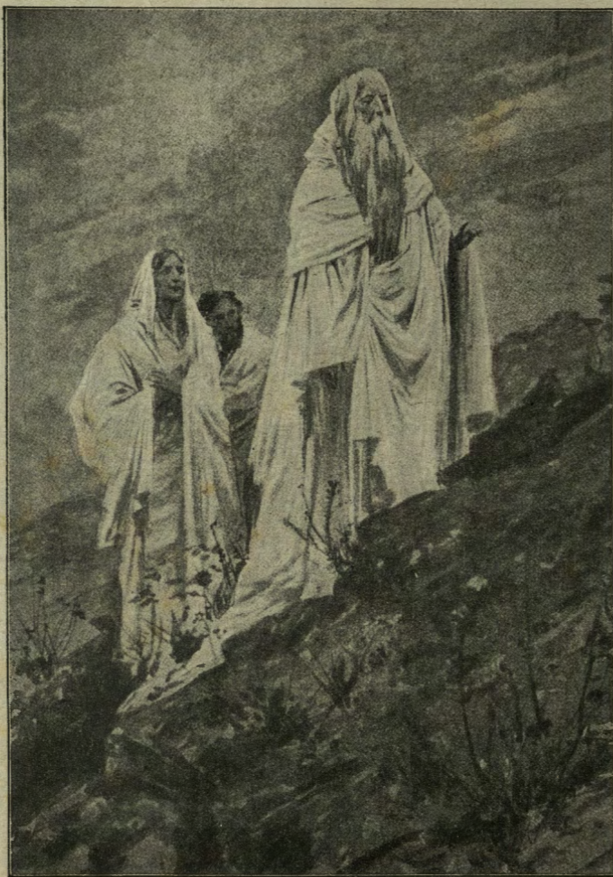
Noi lo seguimmo.