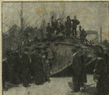
Altro „tank“ inglese catturato dai Germanici.

Fortunatamente il terreno del fronte orientale è sfavorevole ai „tanks“, perché è seminato di monti e segato da fiumi, perché insomma qui mancano le immense pianure del fronte franco-germanico, ove