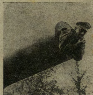
Un soldato germanico che si trastulla nella bocca di un cannone conquistato ai francesi.

„Sinite parvulos venire ad me“ è la frase preferita dai cuochi austro-ungarici nei paesi del Veneto, ove quotidianamente distribuiscono un'ottima zuppa ai bambini poveri, a questi piccoli esseri disgraziati i cui corpi, emaciati per la carezza di nutrimento, portano sovente le stigmate di qualche pernicioso malattia cagionata dalla mancanza dell'alimentazione, così necessaria ai fanciulli di quell'età.