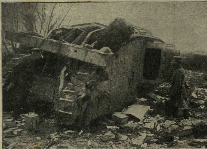
„Tank“ inglese conquistato dai Germanici.

A principio costruì, come le fabbriche inglesi, i mostri enormi che davano l'idea dei sauri preistorici; in seguito fabbricò modelli sempre più piccoli. Ultimamente, poi, ha ideato, e quindi costruito, un nuovo tipo di „tank“, manovrato solo da due persone: dal conduttore e dall'artigliere. Il primo piccolo „tank“, detto il „rapidissimo“ fu mostrato recentemente a Springfield; ma non era ancora blindato, né aveva mitragliatrici. Il modello è sempre lo stesso, solo che quest'ultimo tipo