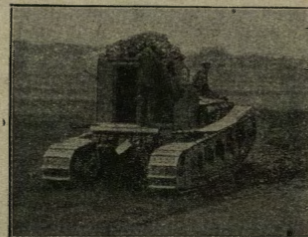
I nuovi „tanks“ rapidi dell'armata britannica.

„È mossa dal vapore, e costruita come i monitori americani, cioè corazzata e protetta contro l'artiglieria. Di dimensioni