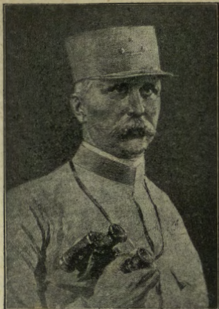
Il generale Pélain, uno dei più quotati comandanti dell'armata francese.