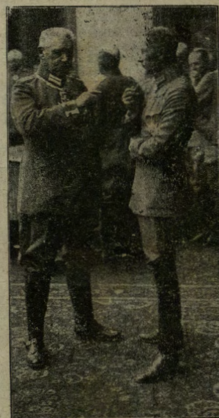
Il principe ereditario di Germania ed il suo comandante maresciallo Hindenburg discutono i prossimi piani di battaglia alla fronte occidentale.