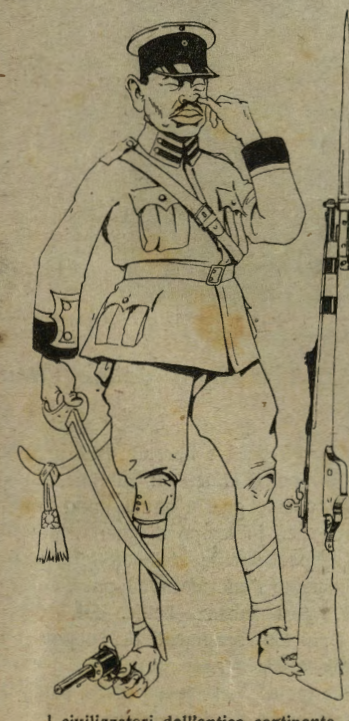
I civilizzatori dell'antico continente.

Super-Economia. In Inghilterra, per mancanza di tabacco, si è costretti a fumare in due una sola sigaretta. Questa vignetta è tolta dall'accreditato giornale umoristico inglese „London Opinion“.)