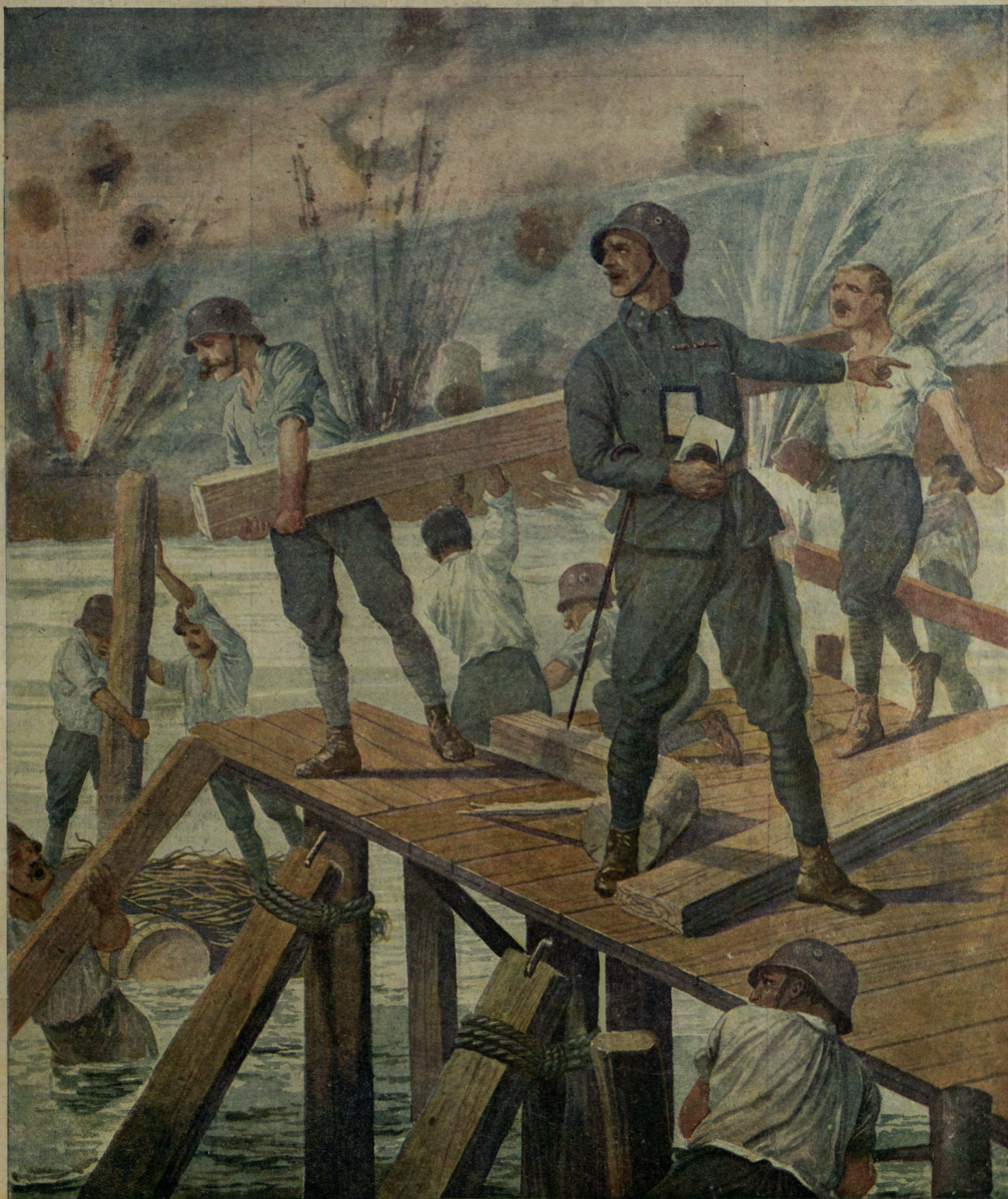
La febbrile operosità delle truppe del genio alla fronte.

Centesimi 25 il numero Austria-Ungheria ed Estero 36 heller