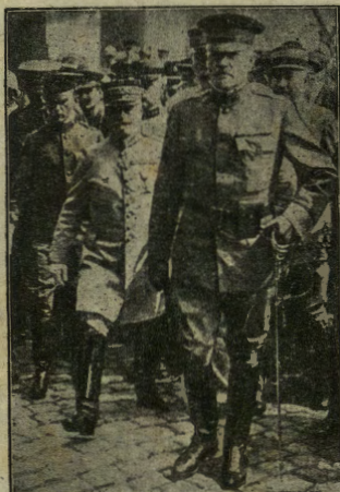
Il generale Pershing, comandante delle truppe americane in Europa, che ancora non ha dimostrato la sua valentia.