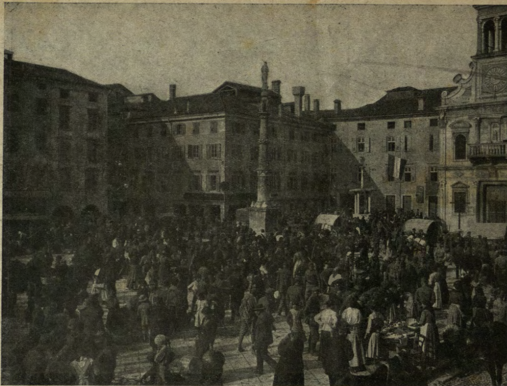
Udine; il febbrile movimento quotidiano in Piazza Mercato Vecchio.