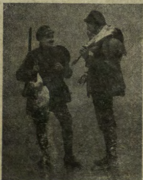
L'approvvigionamento degli inglesi in un paese italiano.

Diffondete „La Gazzetta del Veneto“ e „La Domenica della Gazzetta“