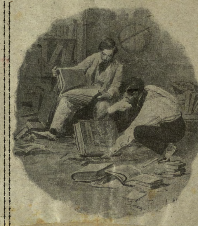
Rovistammo per qualche giorno in tutti gli angoli della Biblioteca...

cisamente accanto alla sala della biblioteca, si apriva nel muro la famosa nicchia di cui mi aveva parlato la guida e che formava appunto la più grande e misteriosa curiosità di quel vecchio rudere.