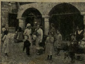
La vendita dei fiori e delle ortaglie nel Friuli occupato.