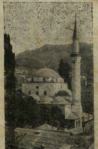
La caratteristica moschea di Serajevo.