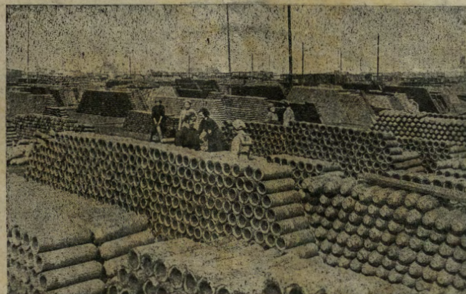
Germania: gran deposito di munizioni.

Lo sopra-velivoli: Questo nuovo riflettore serve principalmente a scoprire gli aeroplani nemici. Infatti, perché munito di appositi congegni, ha anche la virtù di far udire il più piccolo e lontano rumore prodotto dall'apparecchio in volo. È manovrato da due persone, le quali, appena percepito il rumore dell'elica, fanno scattare il poderoso fascio di luce verso la direzione del suono udito ed il velivolo viene così scoperto.