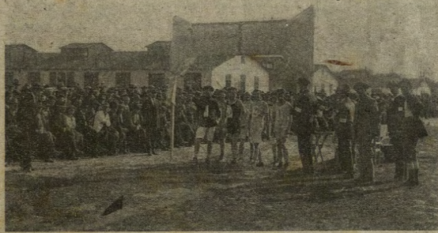
Katzenau; corsa podistica nel campo di concentramento degl'internati italiani.

Poiché se ne son dette tante, e di grosso calibro, sul campo d'internamento di Katzenau, vogliamo dedicarvi anche noi un paio di righe.