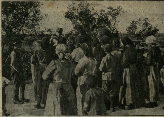
La più recente visita dell'imperatore e re Carlo nel Friuli occupato.