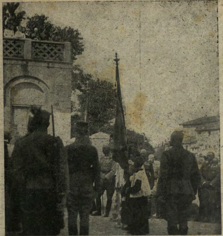
Udine: il maresciallo di campo Boroevic e molti ufficiali austro-ungarici prendono parte ad una funzione religiosa.

La nostra fotografia rappresenta, in alto, un soldato americano che fa la scorta in un crepaccio roccioso; in basso, lo stesso soldato avvolto in una speciale tela color grigio-terra, allo scopo di nascondersi al nemico e di osservarne indisturbato le mosse.