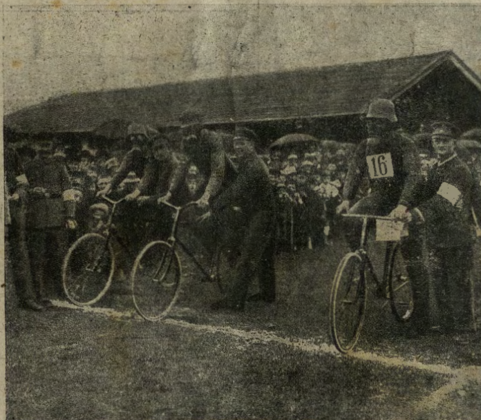
L'utile e il dilettevole. Gara ciclistica fra soldati germanici muniti di maschera contro i gas.