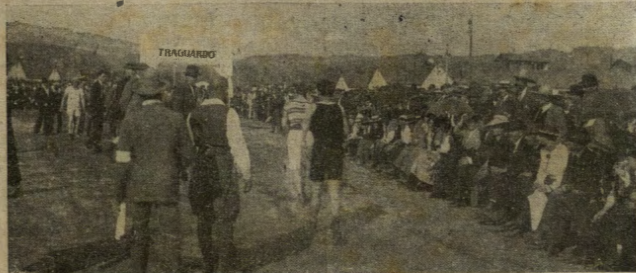
Katzenau, campo di concentramento degl'internati italiani: l'arrivo dei corridori podisti.

Est modus in rebus, o scribacchini d'Italia!