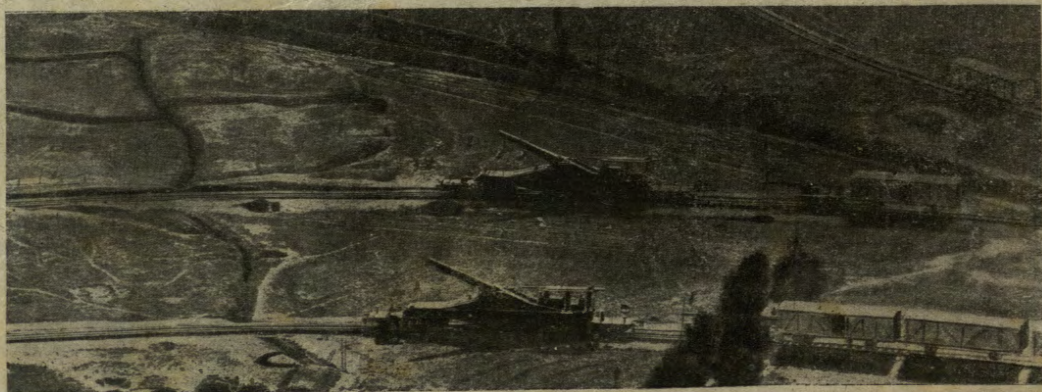
Artiglieria trasportata al fronte per ferrovia, perché di grossissimo calibro.