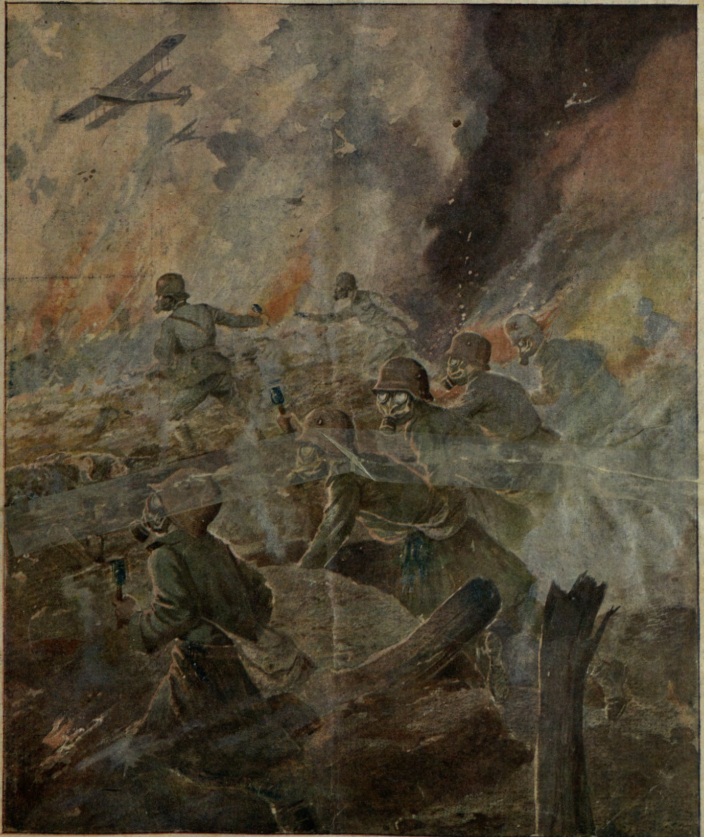
L'orribile aspetto di una battaglia in cui operano i più formidabili mezzi di distruzione: cannoni, gas ed areoplani.

Centesimi 25 il numero Austria-Ungheria ed Estero 36 heller