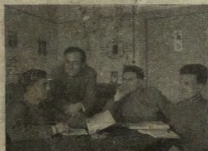
Sigmundsherberg, campo di concentramento dei prigionieri di guerra italiani: ufficiali inferiori nella sala di lettura.