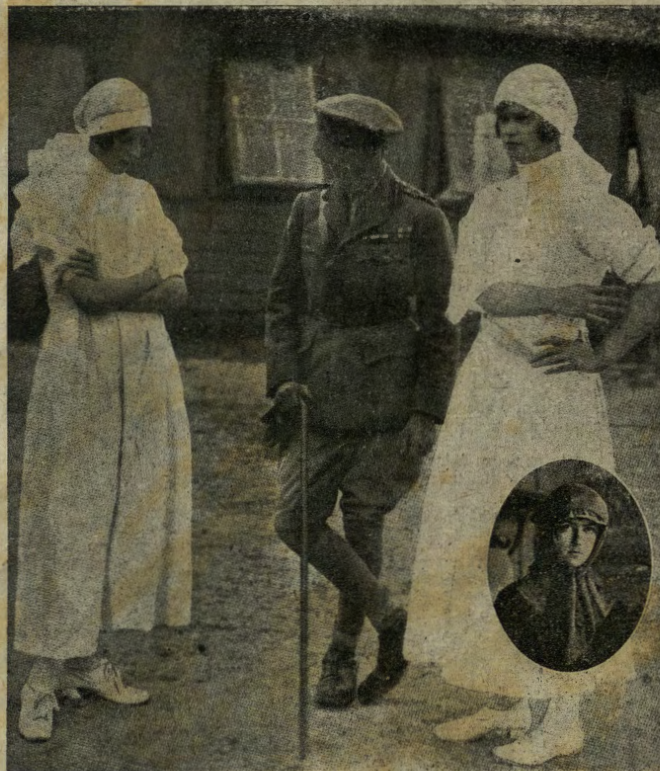
Probabili nozze principesche: Corre voce che il principe di Galles Eduardo Alberto, di anni 24, si fidanzerà con la principessa d'Italia Jolanda, di anni 17, per meglio consolidare l'attuale alleanza fra i due Regni. La nostra fotografia rappresenta il principe di Galles, tra due infermiere, che visita un ospedale francese; in medaglione, la principessa Jolanda di Savoia.