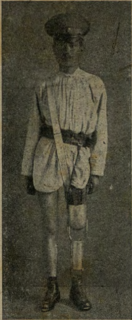
Prigioniero russo rimpatriato.

Una delle tantissime vittime della guerra, ritornata ancor sana fra i suoi cari, per l'assidua ed amorosa cura dei medici austro-ungarici, i quali, non conoscendo nemici dinanzi alla loro santa missione, si dedicano alla salute dell'umanità che langue, posponendo ogni altro interesse.