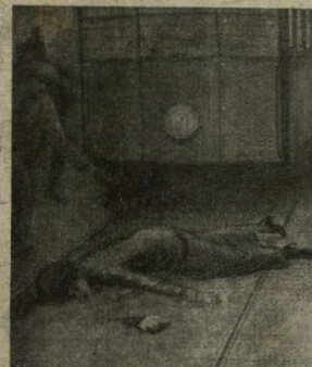
Scorsi poi la fanciulla distesa a terra...

Trasorse un inverno rigido, imbronciato di ghiacci, brontolone di venti impetuosi... E venne la primavera. Tu saprai l'incanto di questa tenera stagione, tutta fremito di vite nuove e di nuovi amori: il sole fugge, i cieli aspidono nell'aria limpida come dopo un