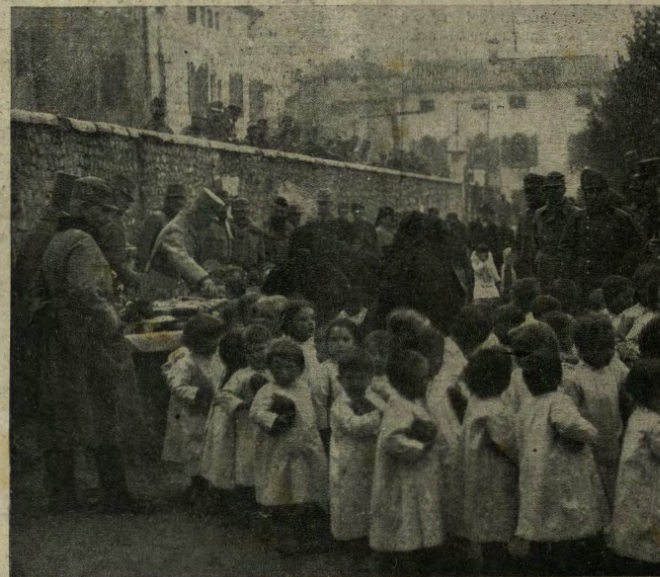
Umanità in un paesello del Veneto: Gli ufficiali austro-ungarici distribuiscono buona parte dei loro viveri ad un lungo corteo di bimbi.