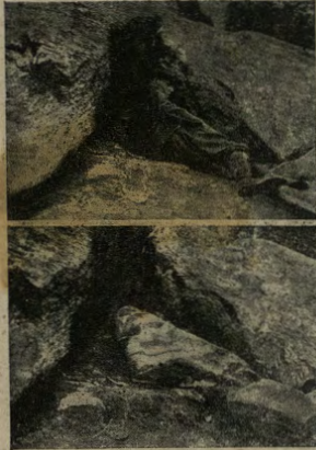
Un uomo trasformato in roccia.

Le armi moderne hanno dato un carattere nuovo alla guerra, che è divenuta un vero gioco a nascondersi. Infatti, chi meglio sa sottrarsi alla vista del nemico è il più bravo e riesce quasi sempre il vincitore.