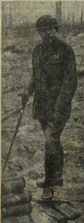
Il Re d'Inghilterra visita un campo dopo la battaglia.

E in tanto le insensate carnicide continuano senza posa! Non si è ancora sazi di tanta carne stolidamente macellata, di