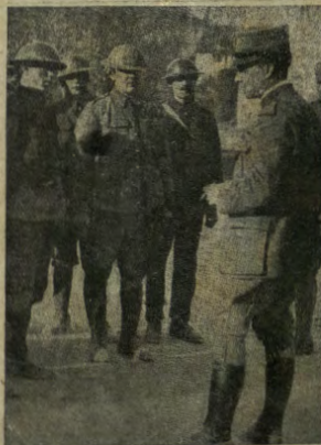
Uno dei figli di Garibaldi parla con alcuni soldati inglesi.