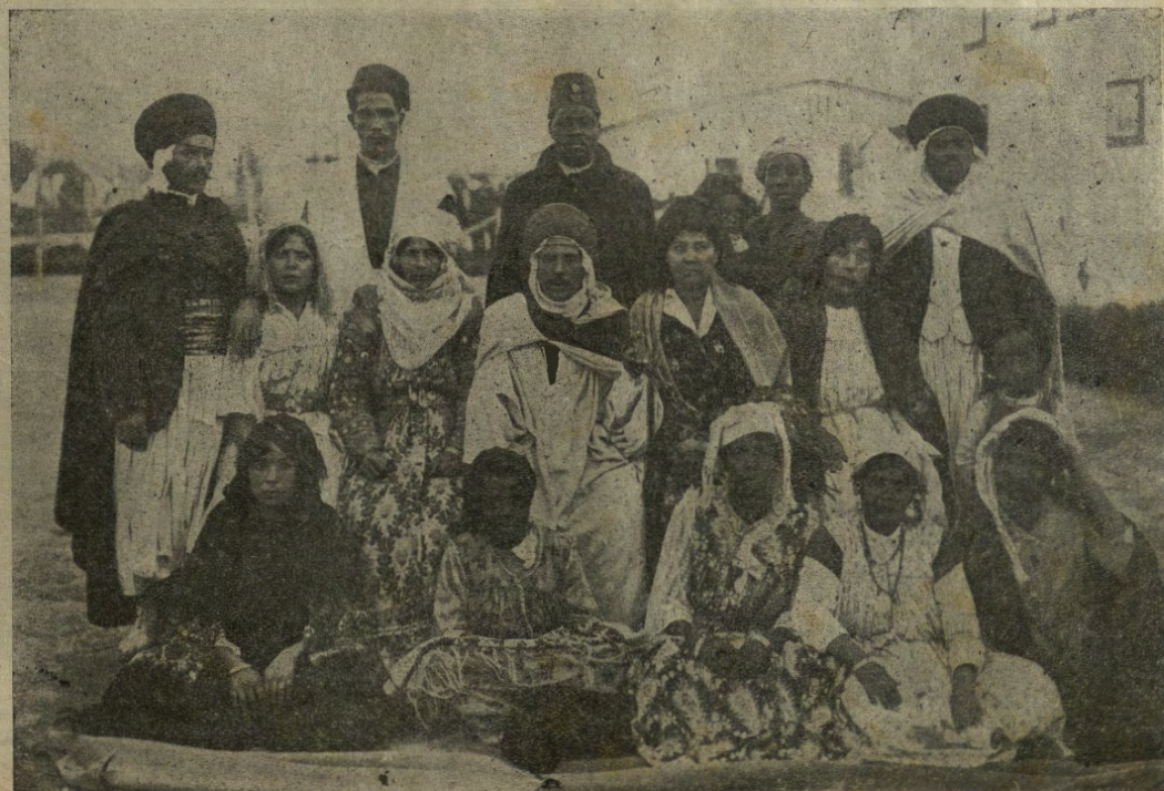
Katzenau. Un gruppo d'internati appartenenti a diversi popoli.

Se l'uomo ha il diritto d'uccidere gli animali per provvedere al suo nutrimento, ha anche il dovere di non martirizzarli inutilmente.