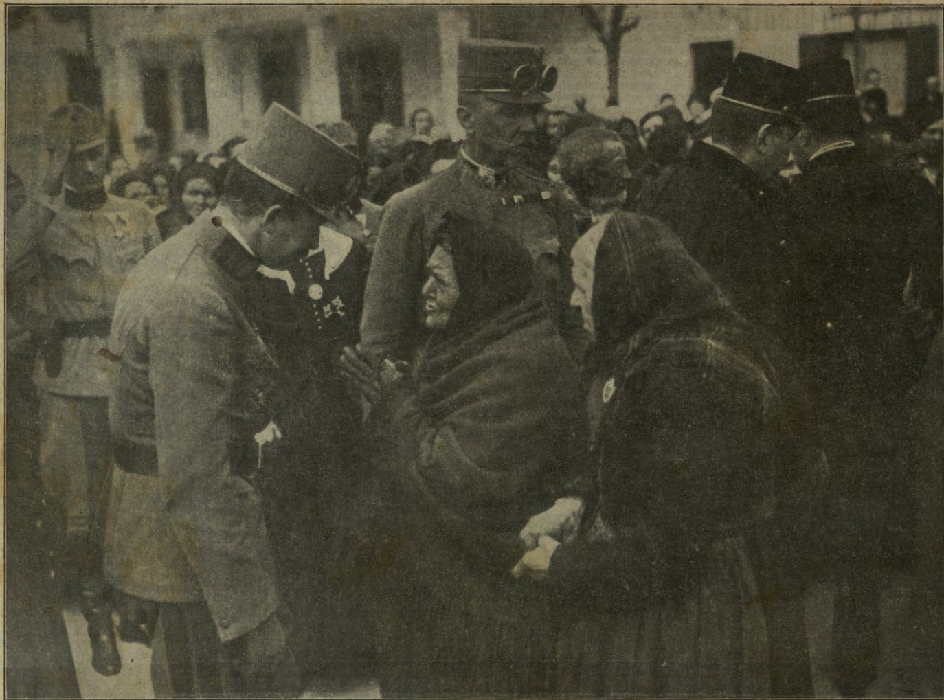
L'imperatore e re Carlo ascolta fra il suo popolo le preghiere di due povere donne.

— Ho capito, — pensai, — qui bisogna mostrarsi un poco signori.