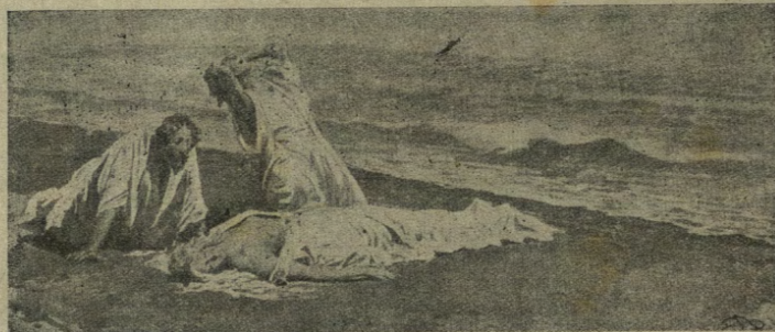
Gettai un grido.

In quel punto sentimmo un orrendo fracasso di acqua che pareva cadere dall'alto, un alito freddo e im-