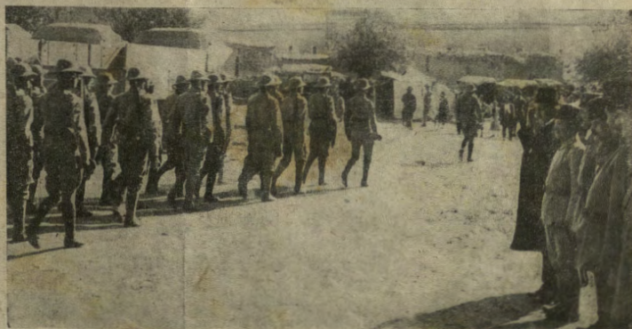
Truppe austro-ungariche sfilano dinanzi alle autorità turche in una città della Mesopotamia.