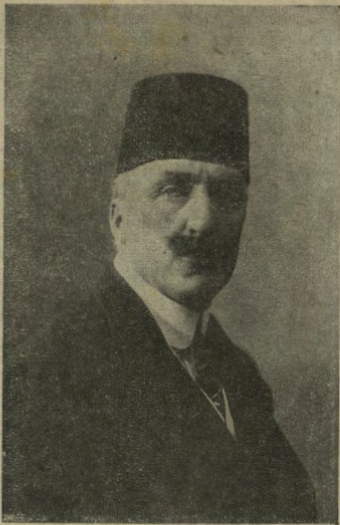
Il principe ereditario turco Abdul Medjid.