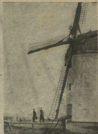
Un mulino a vento nei pressi di Ypres, sul quale si trova un osservatore inglese.

contagiose trasmesse all'uomo dagli animali da macello. Tutti sanno come la via digestiva può rappresentare una porta per il germe della tubercolosi e poiché le carni crude spesso rappresentano un ottimo rimedio terapeutico, l'uso delle carni sane diventa fondamentale per importanza. Ebbene, la differenza che separa, per questo, i bovini si frequentemente infetti di tubercolosi e i solipedi, quasi sempre esenti, è enorme. La tubercolosi bovina oscilla fra il 20 e il 50%, quella equina fra uno per mille e uno per diecimila.