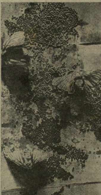
La farfalla sta deponendo le uova.