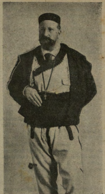
Lo czar Ferdinando di Bulgaria, nel costume nazionale del suo Paese, che attraversa una grave ora.

Lord Lansdowne dice che bisogna farsi ragione fra una pace di compromesso e una pace di distruzione, perché la lotta militare può continuare senza ottenere la