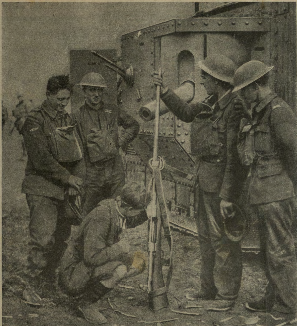
Un lucile germanico contro i „tanks“, conquistato dagli inglesi.