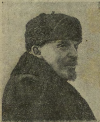
Lenin, il capo della Russia rivoluzionaria, in via di guarigione, sta, già riorganizzando la difesa contro il procedere dell'Intesa.

Si annuncia che il ministro degli approvvigionamenti, on. Crespi, è deciso ad adottare i mezzi più energici per reprimere gli abusi del mercato dei commestibili d'ogni genere punendo severamente tanto gli accaparratori quanto i rivenditori, i quali cospirano al rialzo artificiale dei prezzi. Intanto, per prima cosa, si disciplinerà il mercato delle carni, che se non si trovano così in abbondanza come prima, non sono tuttavia scomparse dai mercati, come farebbe credere la condizione fatta ai consumatori dai rivenditori.