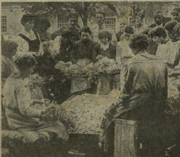
La scelta dei bossoli buoni.