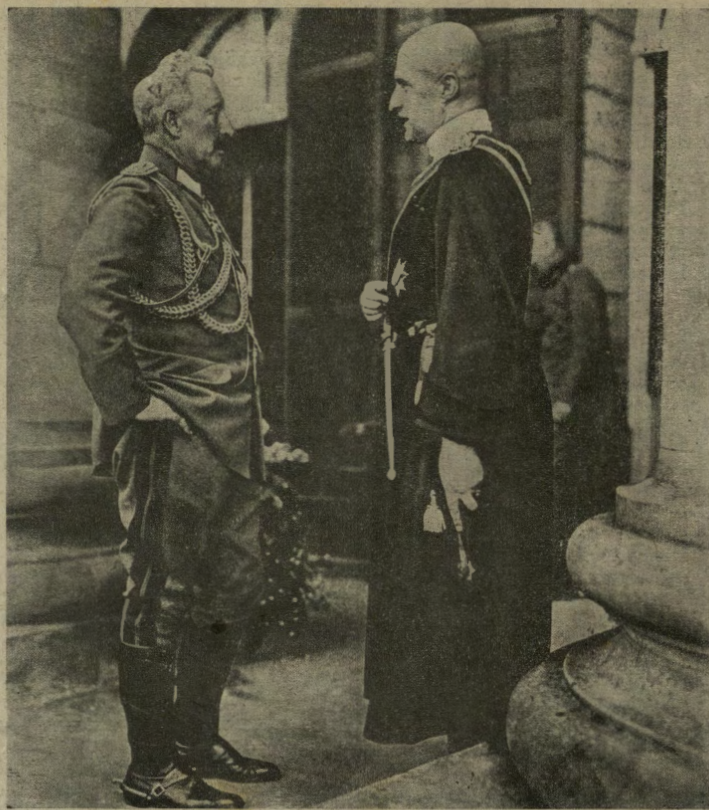
L'imperatore Guglielmo, in conversazione col capo dell'Ucraina, Halman Skoropatskyj, durante la visita di quest'ultimo a Berlino.

E con una spudoratezza unica M. Churchill osa pretendere che la causa del suo Paese è santa e vitale. Secondo lui, escluso Lloyd George, nessuno ha parlato di sterminio, di distruzione, d'annientamento. Churchill continua: „Si è gettato il fiore