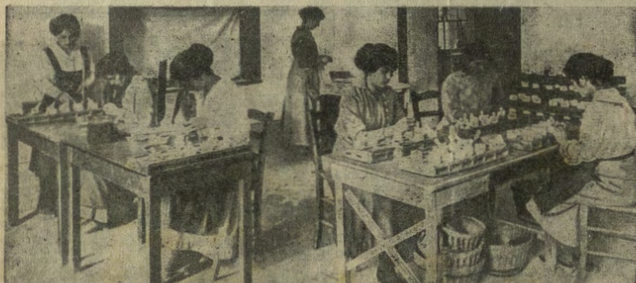
Esame delle farfalle.