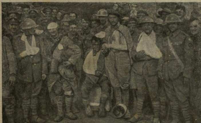
Prigionieri di guerra feriti, appartenenti a diversi Stati dell'Intesa.

Si aggiunga a ciò il fatto delle malattie