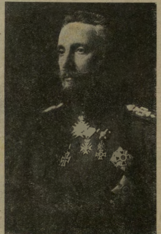
Il Tenente generale Sawew, ministro della guerra bulgaro, cui incombe un gran compito.