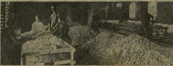
I bossoli vengono accumulati.