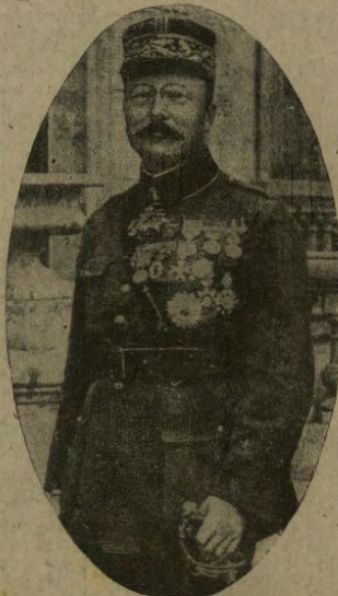
Generale francese Degoutte , uno dei piú validi cooperatori del maresciallo Foch.