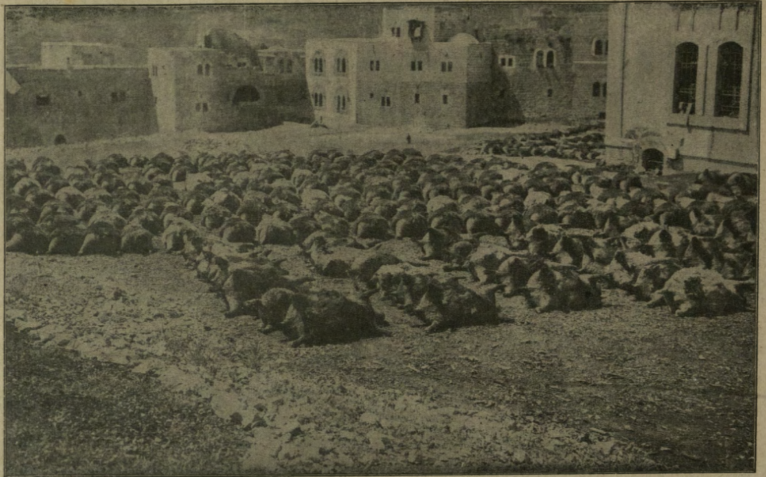
La guerra della Turchia nel deserto. Otri piene di acqua occorrenti alle truppe turche durante l'attraversata del deserto.

cedere le armi. Al comandante il presidio del Monte fu concesso l'onore di portare la sciabola anche in prigionia in premio della valorosa difesa sostenuta.