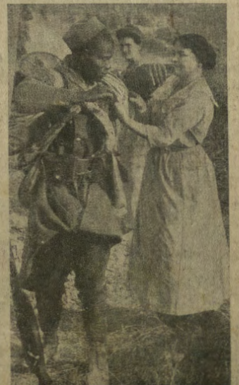
Amicizia ambigua tra una ragazza francese ed un soldato negro.