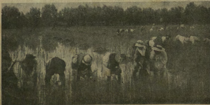
Nel Veneto occupato: la coltivazione del riso.

I gemonesi non si son dati alla fuga, almeno nelle proporzioni notate ad Udine. Le vie della simpatica cittadina sono abbastanza movimentate e nei pubblici ritrovi ferve ancora la vita.