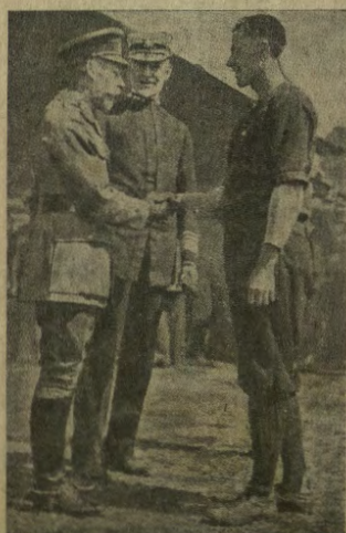
Re Giorgio d'Inghilterra si congratula con un giocatore di "football".