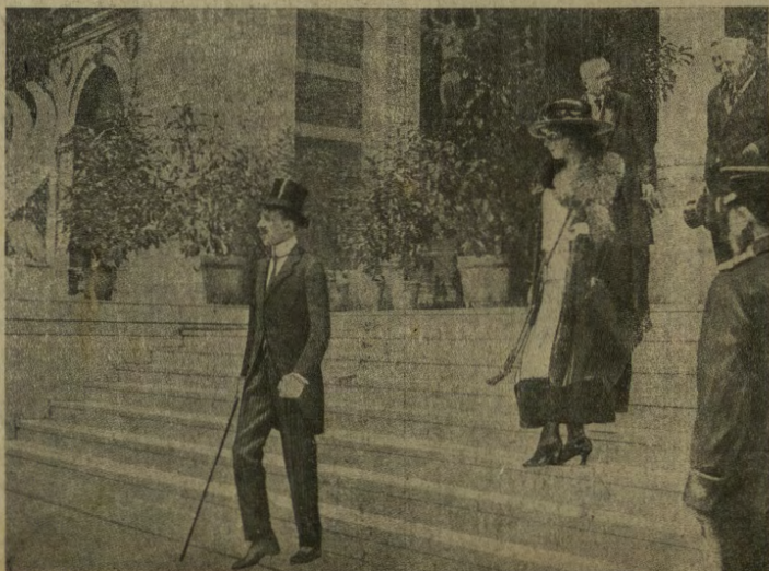
I Reali di Spagna: re Alfonso e la sua bella Consorte.