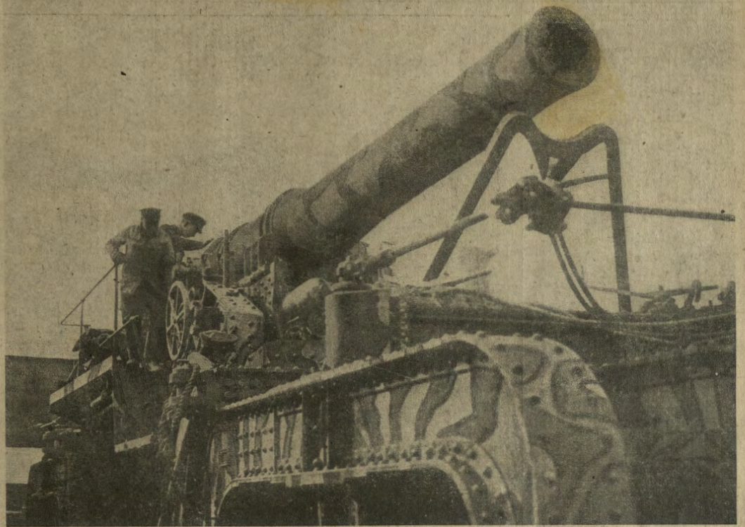
Un gran pezzo d'artiglieria inglese, camuffato con strane pitture, onde sottrarsi alla vista degli aviatori nemici.

Negli ultimi combattimenti sulla fronte occidentale sono state trovate delle cassette di munizioni inglesi contenenti pallottole „dum dum“, quei terribili proiettili che entrando nel corpo umano esplodono, frantumando ogni cosa ed avvelenando la ferita. Questa barbarie, assolutamente proibita dalla Convenzione di Ginevra, non può essere negata dall'Inghilterra, inquantoché dette cassette, per nascondere il loro contenuto, portano l'iscrizione inglese „Specially selected for snipers“, che significa: „Specialmente per tiratori scelti“. La fotografia che noi rechiamo parla abbastanza chiaramente!