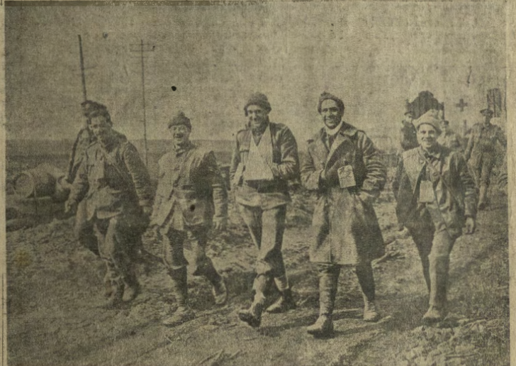
«Ovunque é lo stesso! Feriti leggeri inglesi che ritornano allegramente indietro.