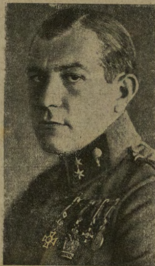
Tenente von Fiala , uno dei piú rinomati aviatori austro-ungarici, che conta a suo attivo già 25 vittorie aeree.