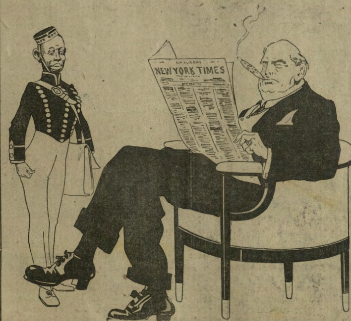
Come l'America aiuta l'Intesa.

Un industriale miliardario (commentando il giornale): — A che vale la riuscita della controffensiva di Foch, se le azioni del ferro non rialzano?