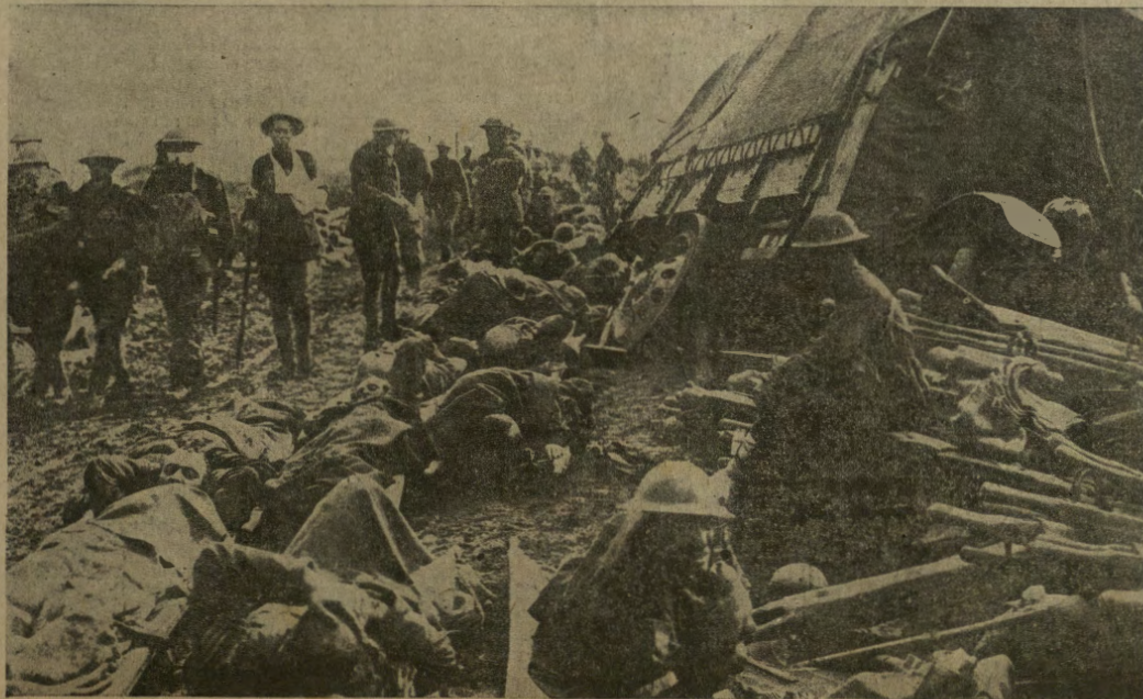
Un trasporto di feriti inglesi.