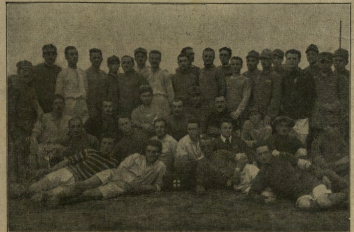
Sigmundsherberg, campo di concentramento dei prigionieri di guerra italiani. Una squadra di giuocatori di „football“.

mente apparecchiata e cominciò subito ad intavolar discorsi condendoli di quei lazzipepati per cui era tanto famoso. Prima di tutto vennero servite due dozzine di ostride inafiate da un vinello agreste, che le mandava giù come l'olio e lasciava sulla lingua insieme con la loro salsedine un sapore frizzante piacevolissimo. Indi venne un grosso pesce martello in bianco con un limone in bocca e il frate, che ne era ghiotto, ne prese una buona porzione. La portata seguente furono certi pasticcini di pesce che si scioglievano in bocca tanto eran ben fatti. Il padre non ne prese che due non volendosi gustare troppo l'appetito per il pollo che doveva seguire e pel quale avea un debole. Ma la sua aspettativa fu delusa, perché ai pasticcini di pesce seguì pesce fritto e poi ci furono delle belle fette di tonno sott'olio ed un salmone dalle carni rosa prelibato, ma di cui il padre prese pochissimo perché di pesce, in tutti gli intingoli e in tutte le salse, ne aveva già abbastanza: Infine il re