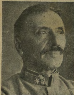
Generale colonnello Pfanzer-Balbin , comandante delle truppe austro-ungariche in Albania, che hanno riportato brillanti successi nella recente vittoriosa controffensiva, conquistando, fra le altre importanti posizioni, le città di Fieri e Berat.