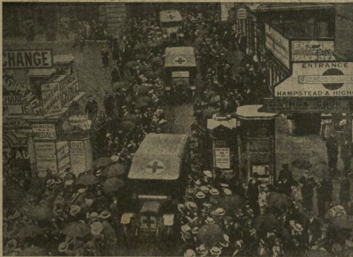
L'arrivo a Londra dei soldati feriti alla fronte occidentale.