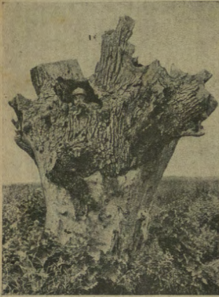
Un posto d'osservazione sulla fronte occidentale: vedetta francese in un tronco d'albero.