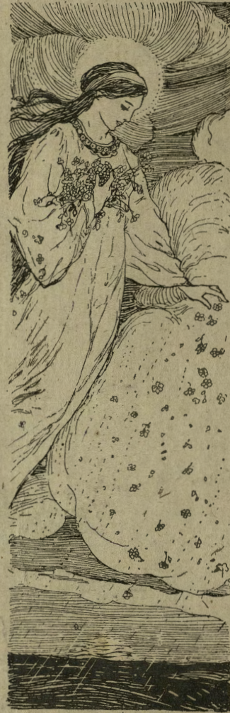
Ella era una creatura fatta di anima e di luce.

I quattro più giovani, che già avevano cosparsa di essenze incorruttibili, sollevaron ora la salma, l'avvolsero nei drappi che avean