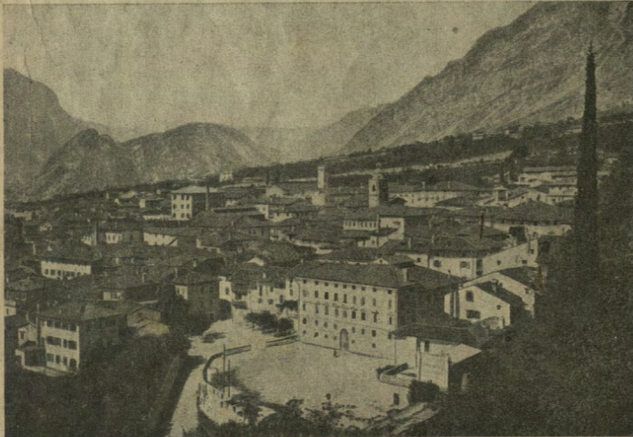
Gemona: il panorama della città ed il monte S. Simeone.

L'attraente cittadina giace ai piedi del monte che s'eleva ripido e roccioso su una pendice diradante lenta sino al Tagliamento. Anche oggi, che tocca i 10.000 abitanti, ha la sua importanza commerciale pari a quella di Udine.