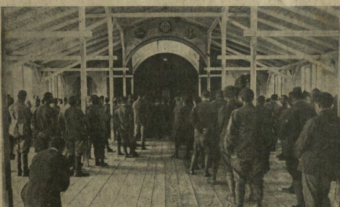
Mauthausen, campo di concentramento dei prigionieri di guerra italiani. I fedeli assistono alla messa domenicale.

del sovrano ed il rispetto dovutogli. Un bel giorno il buon padre prese tutto il suo coraggio a due mani e tenne al re un predicazzo salato sulla santità del matrimonio, sulla necessità di mantenere la fede promessa e sul cattivo esempio che dava ai suoi sudditi. Il re non se l'ebbe a male e stette ad ascoltarlo senza dir nè sì nè no. Quando il confessore ebbe finito, gli baciò il cordone da quel devoto di egli era, lasciando in questi l'illusione d'averlo convertito. Ma, ripeto, non se l'ebbe a male, ed alcuni giorni dopo invitò il padre a pranzo, che accettò di buon grado, sapendo per esperienza quali succolenti pranzetti amasse il re e contento come una pasqua di questa prova di defezione e d'amicizia. Difatti, il re gli venne affabilmente incontro, lo condusse ad una tavola sontuosa-