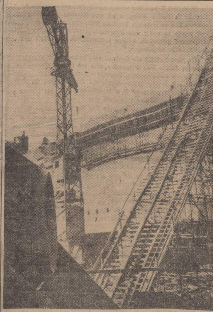
Die «Himmelsleiter», in einem Atlantikstützpunkt sind die Erleuchtungsbauten der Bunker so weit fertig, dass jetzt das Dach des Bunkers gegossen wird. In die Kisten Zuleitungsrohre fliesst das Benzin. Auf dem Bunkerdach

Es ist fast festzustellen, um das eigene militärische Unvermögen Cassino zu erobern, nicht eingestehen zu müssen, wurde eines der grössten Kulturdenkmäler aller Zeiten von den Anglo-Amerikanern bedenkenlos in Trümmer gelegt. Den Deutschen, die auch hier für Kulturverluste Verantwortungsgefühl unter Zurücksetzung ihrer militärischen Interessen bewiesen haben, um dieses grossartige Bauwerk der Welt zu erhalten, versucht man Tag