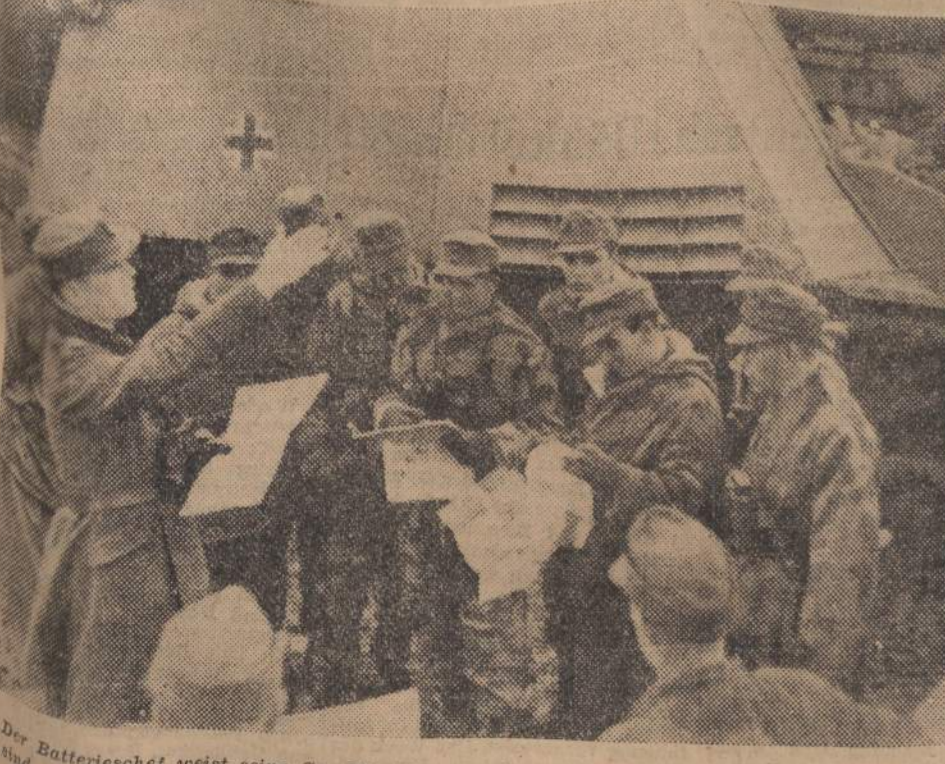
Die Batterieschiff weist seine Geschützführer in die genaue Lage ein. Die Bolschewisten sind am vergangenen Tage die deutschen Stellungen eingebrochen und sollen durch einen Gegenstoss zurückgedrängt werden.

Die Masse des italienischen Volkes jedenfalls blieb passiv — bis zu Garibaldi Zeiten, und bis Mussolini sie schliesslich sogar zu einer Macht formte, die weltpolitische Bedeutung gewann. Bis dahin war sie sozusagen jedes Herrs Knecht, und nichts geschah um ihr willen, sondern immer und ausschliesslich nur im alleinigen Interesse des jeweiligen Herrn oder vielmehr der vielen Herren, die mit ihr schalteten und walteten, wie es ihnen gerade in ihren höchst-eigenen, machtpolitischen Kram passte. Das Land war schön, das Land lockte — die Gerien kamen und wurden wieder verdrängt von noch Geriergen. Das italienische Volk aber konnte sich all dieser politischen Raub- und Glücksritter, die sie Jahrhundert für Jahrhundert heimlich suchten wie eine Landplage, nicht erwehren und blieb ärmlich und machtlos — aber noch schlimmer: der ständige Wechsel in der Führung machte es selber unbeständig, weiterwandelnd, skeptisch — wer wollte doch noch alzu hart urteilen! Mal gehörte so eine italienische Provinz der Republik Venedig, mal dem Herzog von Mailand, mal dem Papst, mal dem deutschen Kaiser, mal dem französischen König, mal regierten in ihr die Spanier und ein andermal die Oesterreicher. Gibt es denn ein