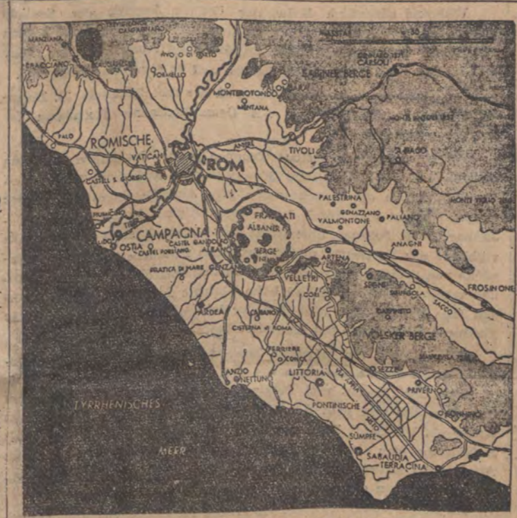
Das Schlachtfeld vor den Toren Roms