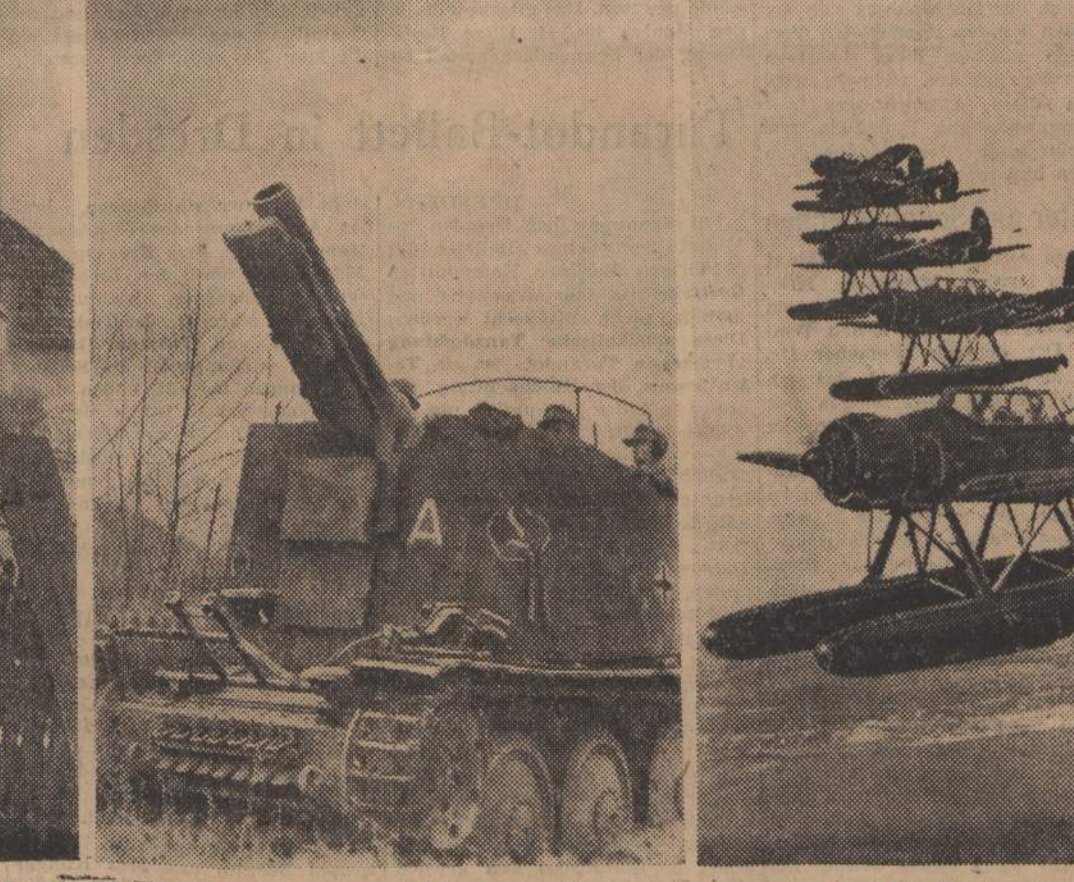
Ein schweres Infanteriegeschütz auf Selbstfahrlafette belegt, ein von Banden bestütztes Dorf mit seinem Feuer.