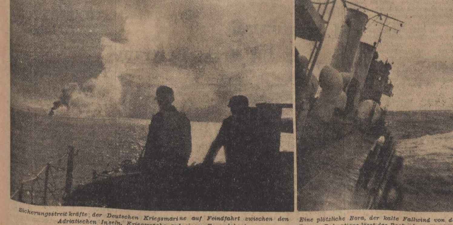
Sicherungsstreitkräfte der Deutschen Kriegsmarine auf Feindfahrt zwischen den Adriatischen Inseln. Kriegsschiffe auf einem Torpedoboot

Schreibt der Sonderkorrespondent des «Daily Telegraph» bei der fünften USA-Armee seien ständig direktem feindlichen Beschuss ausgesetzt. Amerikanische Infanterie, die vorübergehend nach Cassino selbst einbrach, habe sich nach zähen Ringen mit den Deutschen auf ihre Ausgangsstellungen zurückziehen müssen. Die deutsche Abwehrmethode liesse sich nicht still und lassen das Artilleriefeuer ruhig über sich ergehen, sodass bei den alliierten Kommandierenden der Eindruck entstehe, als begegne ein