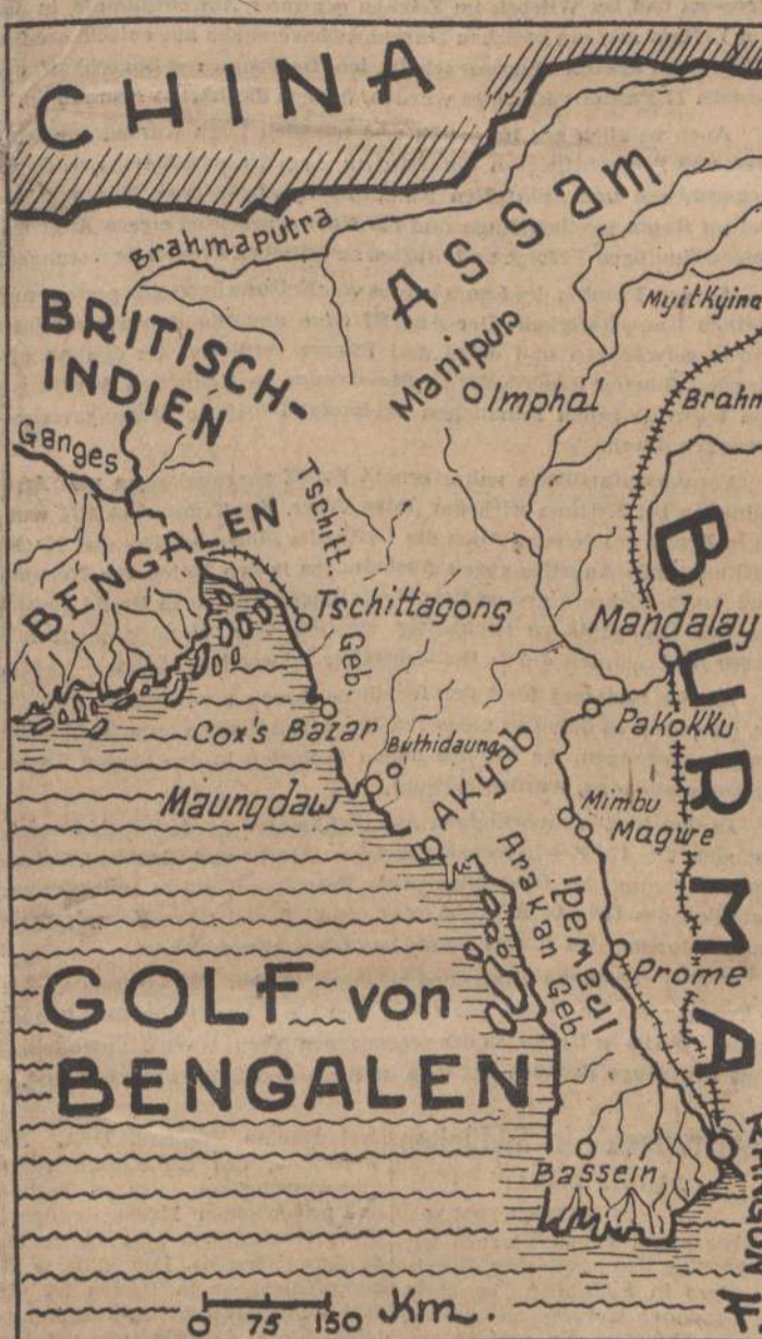
Nach ihrem Invasionsunternehmen gegen die Marshall-Inseln versuchen die Angloamerikaner jetzt auch an der indisch-burmesischen Grenze die japanische Abwehrfront anzugreifen.

Der Reichsminister für Rüstung und Kriegsproduktion führte u. a. aus: Im fünften Kriegsjahr müssten alle irgendwie verfügbaren Reserven für die bevorstehenden Entscheidungskämpfe eingesetzt werden. Dank dem trotz aller feindlichen Terrorangriffe und sonstigen Schwierigkeiten günstigen Stand unserer Rüstung, der in erster Linie der vorbildlichen Haltung des deutschen Arbeiters und der deutschen Betriebsführer, die insbesondere in den von Bombenangriffen heimgesuchten Städten wahrhaft Vorbildliches leisteten, zu danken sei, seien hierfür als rüstungsmässig die notwendigsten Voraussetzungen vorhanden. Besonderer Dank gebühre dabei auch den deutschen