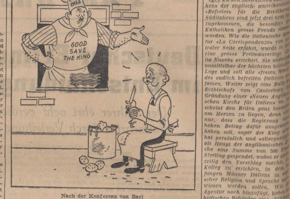
Nach der Konferenz von Bari 'Jetzt kann ich ihn noch nicht einmal mehr zum Kartoffelschalengebrauchens'