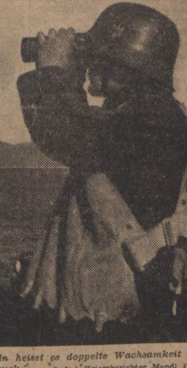
Im Feuerbereich der Banden auf den Inseln heisst es doppelte Wachsamkeit für den Ausguck

In den Piemontesischen Alpen wurden von der italienischen Polizei sechs entwichene englische Kriegsgefangene aufgeföhrt, die sich hier seit dem Tode des Wachenstandes von Badoglio verborgen gehalten hatten. Seit Monaten bildeten sie den Schreck der Bevölkerung. Fünf von ihnen wurden zum Tode verurteilt.