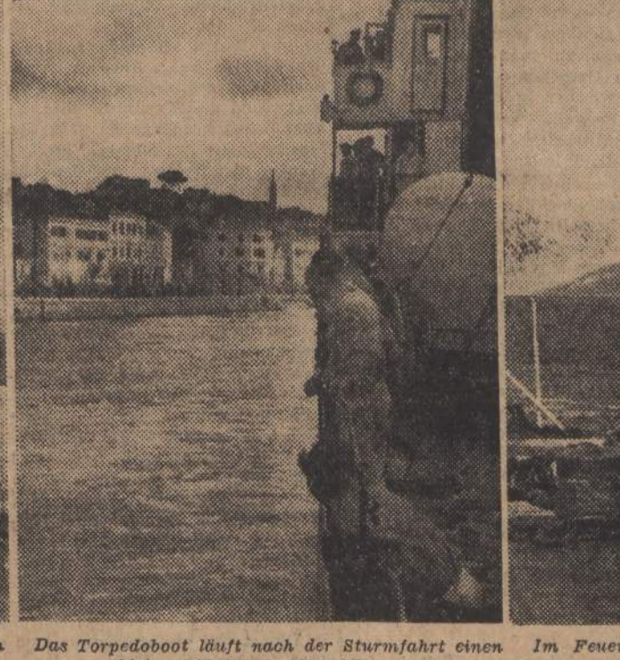
Die paläolitische Bora, der kalte Fallwind von den Bergen Dalmatiens lässt das Bootschauer überholen