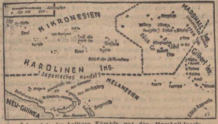
Schauplatz der heftigen Kämpfe auf den Marshall-Inseln