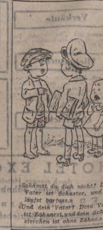
«Schämst du dich nicht? Dein Vater ist Schuster, und du lästst dir etwas an.» «Und dein Vater? Dein Vater ist Zahnarzt, und dein Schwager ist Zahnarzt, und dein Schwager ist Zahnarzt.»