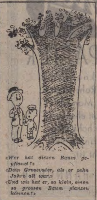
«Wer hat diesen Baum gepflanzt?» «Dein Grossvater, als er zehn Jahre alt war.» «Und wie hat er, so klein, einen so grossen Baum pflanzen können?»