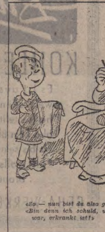
«50 — nun bist du also glücklich der letzte in der Klasse.» «Bin doch schuld, wenn der, der bisher der letzte war, erkrankt ist!»