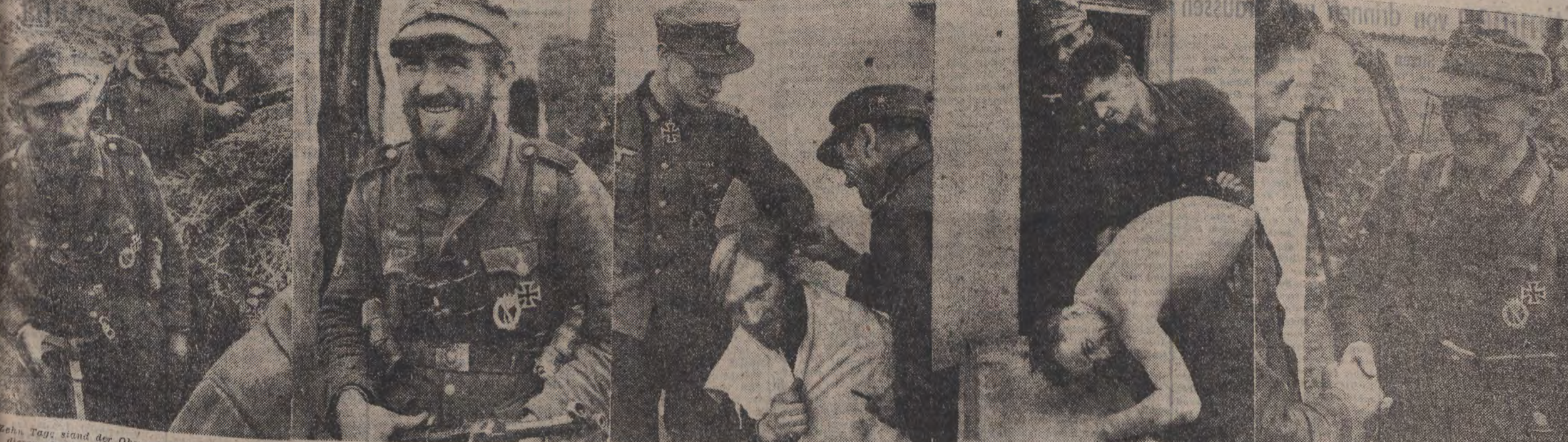
Freier Tag stand der Obergefreite ununterbrochen in diesem Graben der HRL auf einem Brückenkopf PK-Inf. Kriegserichter Sebezer (P32). Aber jetzt ist sein freier Tag. Bei Nacht hat er die Stellung verlassen und kommt nun glücklich strahlend vor dem 'Erholungsheim' an. Zuerst muss einmal die Welle herunter. Zur Not tut's auch ein ungeplanter Friseur. Der Kommandeur verleiht die 'Tortur' interessiert. Mittlerweile ist auch das Wasser heiß geworden und man kann sich in dem bösern Waschtopf den zehnjährigen Dreck vom Leibe waschen. Gut ausgerollt, gewaschen, rüstet und mit neuer frischer Polsterung geht der Gebirgsjäger am nächsten Tag wieder nach vorn.