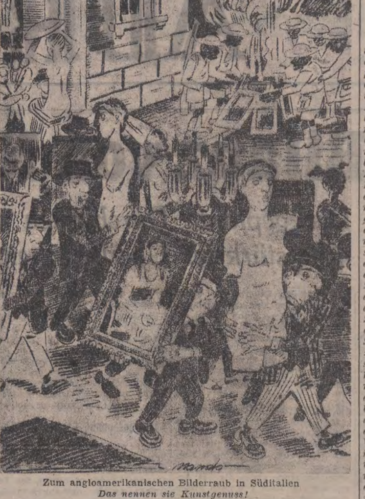
Zum angloamerikanischen Bilderraub in Südtalien Das nennen sie Kunstgenuss!