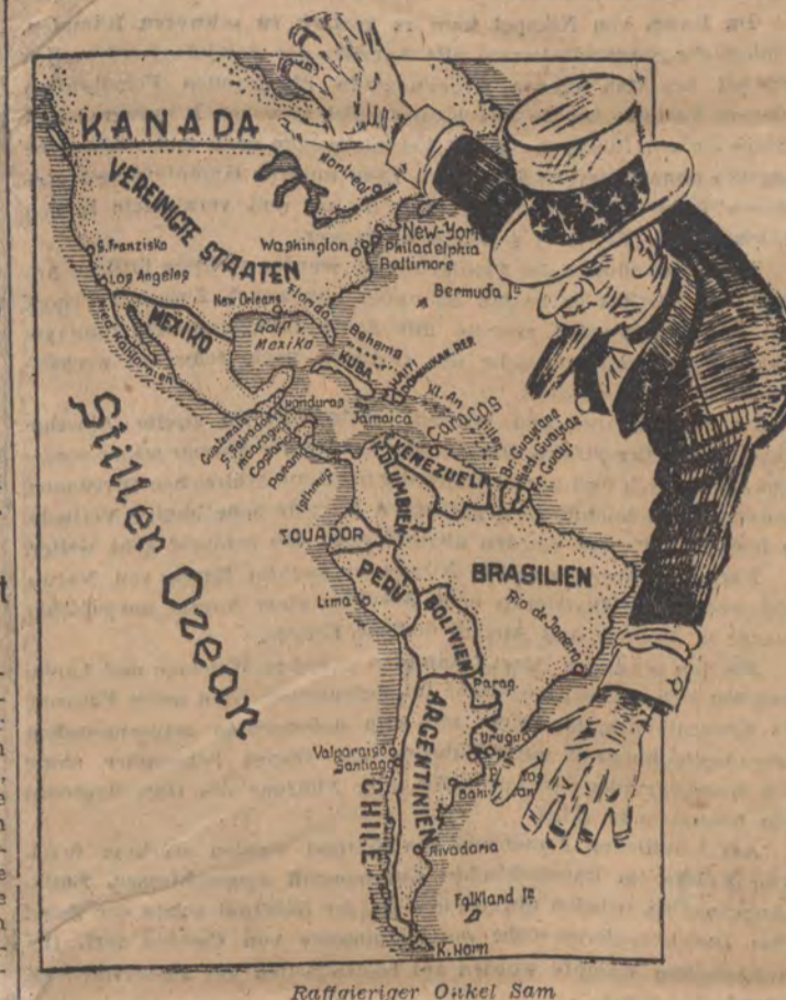
Raffigieriger Onkel Sam

Schwere Kämpfe in Südschmitt Im Dnjepr-Knie gelang es den südwestlich Dnjeprotrowsk wiederum mit grosser Wucht angreifenden Bolschewisten, ihre Einbrüche weiter zu vertiefen. Die Spitzreiter des starken Infanterie- und Panzerverbänden gebildet, feindliche Stosskräfte drangen gegen die Bahnhöfe Dnjeprotrowsk-Krowograd vor. Die Kämpfe gegen den Feind, der immer wieder versucht, die Pfeiler zwischen den einzelnen fingerartig nebeneinanderliegenden Einbruchstellen zu überwinden, gipelten in unermüdlicher Heftigkeit an. Im Raum zwischen Krowograd und Belaja Zerkow versucht sich der Feind mit neu herangeführten, südwestlich Tscherkassy angesetzten Kräften durch eine Frontlinie weiter vorzuschieben und den linken Flügel einer deutschen Kampfgruppe zu umfassen. Der Versuch misslang, da unsere zum Gegenangriff vorstossenden Panzer die feindliche Infanterie in der Flanke fasste und zersprengte. 29 Panzergeschütze und über hundert Gefährten fielen dabei in unsere Hände. Die deutsche Infanterie hat sich in der Flanke gefestigt und zersprengte 29 Panzergeschütze und über hundert Gefährten fielen dabei in unsere Hände.