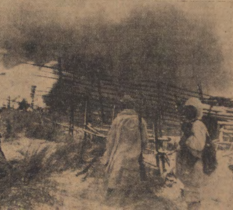
Ein bolschewistischer Schlupfwinkel sollte ausgeräuchert werden. Der Auftrag ist ausgeführt, Einige Fischerkaten stehen in hellen Flammen. Von den Sowjets ist nichts übrig geblieben