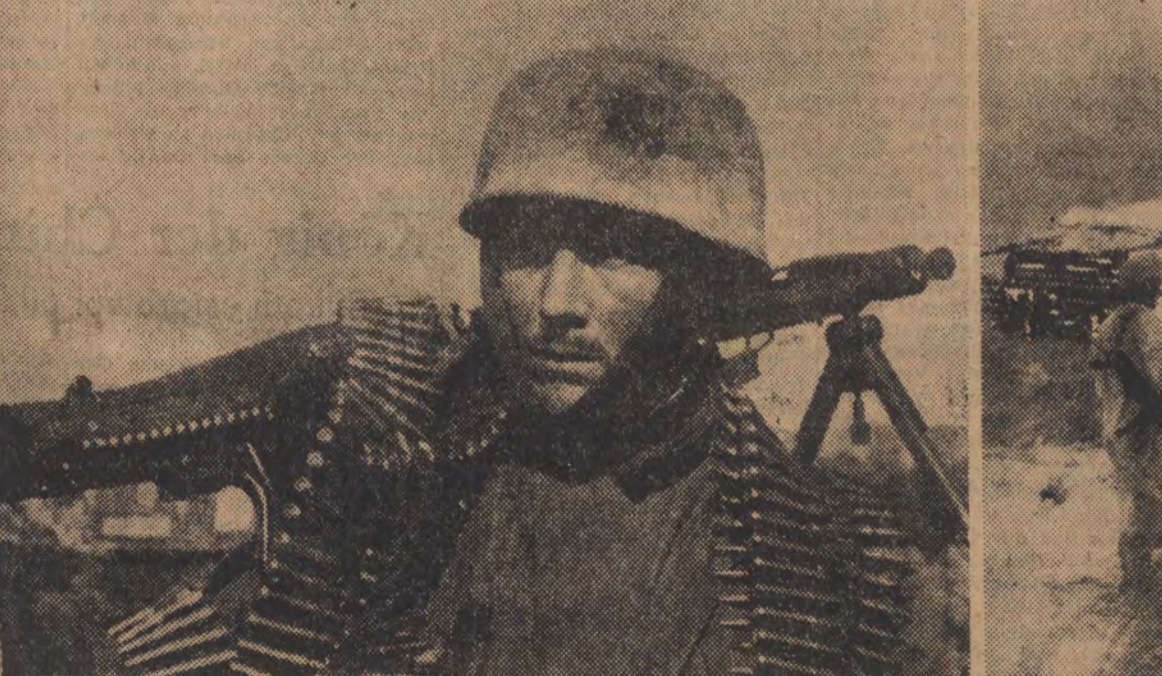
Trotz zweifelhafte Ansturm kurz hintereinander gelang es den Sowjets nicht, durchzukommen. Doch regt die Anspannung der letzten Stunden auf dem Gesicht dieses Fallschirmjägers. Doch entschlossen wie seine Haltung ist auch sein Wille