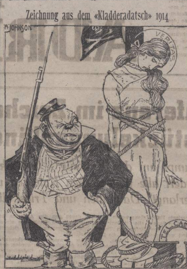
Wie 1939: Die gefesselte Wahrheit — John Bull's erste Heldentat