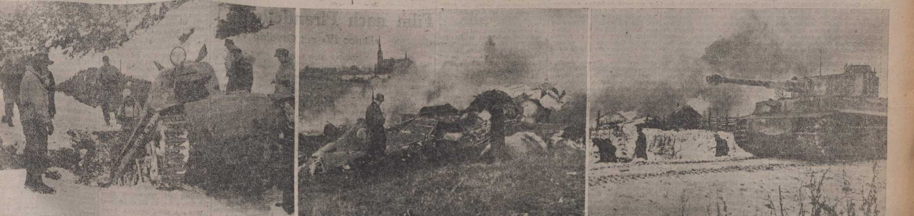
Ein Banditenzentrum in Montecastro wird zerstört. Die Banditen haben mit Strassensprengungen gearbeitet. Die Panzer macht das nichts aus. Sie überwinden das Sprengloch und eben es für die nachfolgenden Fahrzeuge etwas. Friedhof der Viermotoren. Einer von den bei einem Tagesangriff im besetzten Westteil der Ortschaft abgeschossenen Terrorbomber. Er stürzte brennend auf eine Wiese. Die unübertreffliche Feuerkraft der Panzer bahnte den Grenadiere, die im Gegenstoss ein von den Sowjets besetztes Dorf wieder nehmen sollen, den Weg. Schon sind sie bis zur Mitte der Ortschaft vorgedrungen, aus deren Häusern Flammen und Rauch gen Himmel steigen.

BERLIN Während die feindlichen Landkräfte im pontinischen Küstengebiet getrieben werden, sind die Luftkräfte im Brückenkopf Nettuno herbeigekommen. Im Brückenkopf Nettuno herrscht nur geringe Kampftätigkeit. Der Gegner versuchte, über den Kanal Mussolini vorzustossen. Seine Angriffe wurden zum Stehen gebracht, ein weiterer Angriff in Batallionsstärke abgewiesen, während ein anderer Vorstoss im Feuer der deutschen Artillerie liegen blieb. Die am 25. Januar gegen den Ort Aprilia und hart an der Küste mit Panzern geführten Vorstöße des Feindes scheiterten. Versuche des Gegners, sich durch gewaltsame Erkundungen und Aufklärungsanstöße Klarheit über die deutschen Abwehrmassnahmen zu verschaffen, blieben erfolglos. In einzelnen wird gemeldet, dass britische Erkundungstruppen nordwestlich Nettuno längs der Küste vorzustossen suchten, wo sie