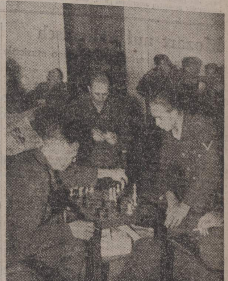
Am Abend treffen sich die Soldaten beim Brett- oder Kartenspiel oder aber bei einer ausgedehnten «Weinprobe». Doch am ersten Tage geht es früh zu Bett, die vergangenen anstrengenden Wochen an der Südfront legen noch in den «Knochen»