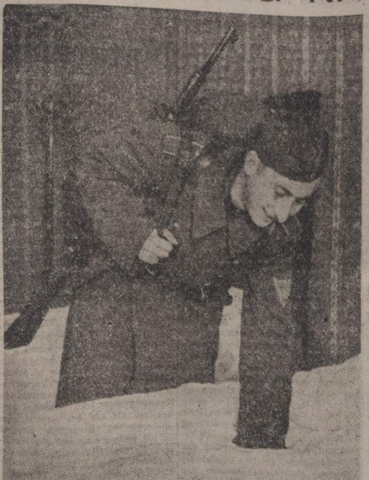
Ja, gibt es denn so etwas auch nachts? In einem solchen Bett soll ich schlafen! Das sind die sich immer wiederholenden Ausrufe der «Landsers»