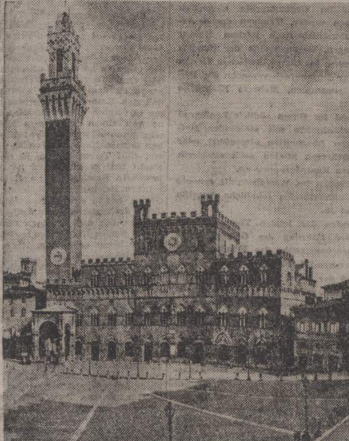
Auf der Piazza del Campo, dem Mittelpunkt der Stadt Siena erhebt sich der gotische Palazzo pubblico mit seinem 102 Meter hohen Turm

Polen, ausschliesslich von den deutschen Truppen erfochten, veranlasste den Führer zu einem erneuten Friedensangebot an die Westmächte; es wurde durch die internationalen und jüdischen Kriegshetzer abgelehnt. Der Grund lag bereits damals darin, dass England — mit einer gewissen Berechtigung — darauf baute, eine europäische Koalition gegen Deutschland unter Einschluss des Balkans und der Sowjetunion mobilisieren zu können. Dies alles sind Tatsachen, die niemand wiederlegen kann — Tatsachen, die die ganze Skrupellosigkeit des sowjetischen Vertragspartners dokumentieren. Wenn der Londoner Nachrichtendienst uns und der Welt heute den Verrat des Krimleids eindeutig bestätigt, so nehmen wir die Enthüllung mit Genugtuung zur Kenntnis. Das deutsche Volk wird dadurch in seinem Glauben bestärkt, dass die Handlungen des Führers in dem Komplex Deutschland-Sowjetunion in jedem Augenblick wohl abgewogen waren und den Interessen des Volkes dienten. Europa aber erkannte abwärts, in welchem riesengrossen Gefahr es geschwebt hat und dass es von dem hochgerüsteten bolschewistischen Koloss in jedem Augenblick werden würde, wenn nicht Deutschland den Angriffsbereitschaft der Bolschewisten durch den Krimleids zuvorgekommen wäre.