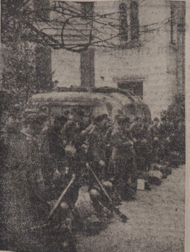
Boonen ist ein neuer Trupp Frontsoldaten angekommen. Für acht Tage werden sie in einem Erholungsheim der Südfront fürorglich betreut. Nach dem Verleeren der Hausordnung beginnt die «Einweisung»