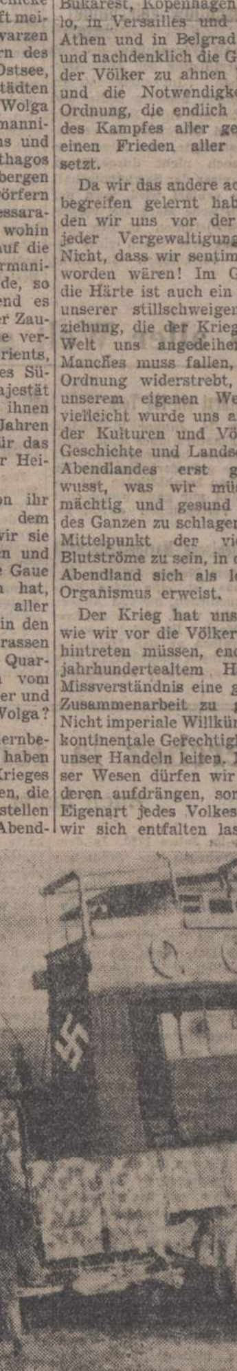
Kurze Rast unserer Gebirgsjäger während eines Spähtruppenunternehmens in Süditalien

während eines Spähtruppenunternehmens in Süditalien