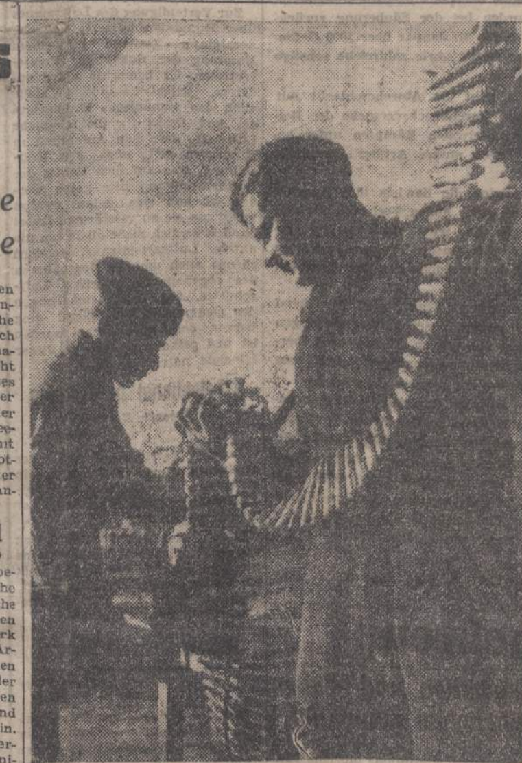
Wie bei einer Kette, so ist Geschoss neben Geschoss auf dem HLG-Gurt gereiht. Aufmerksam prüft der Waffewart den Zustand der Patronen

BERLIN. Am Nordabschnitt der Ostfront kam es am Sonnabend besonders südwestlich Leningrad und nördlich des Imenensees wieder zu schweren Abwehrkämpfen, in denen unsere Truppen die erneuten feindlichen Durchbruchversuche zum Scheitern brachten. Wesentlich schwächer dagegen waren die Angriffe der Sowjets in dem Wald- und Seengebiet nördlich Nowel. Hier erreichte der feindliche Kräfteinsatz nur einen Bruchteil des vorstigen. Eine Kampfgruppe von etwa 500 Bolschewisten wurde bis auf geringe Reste vernichtet. Besonders schwer waren die Kämpfe im Raum zwischen Pripjet und Beresina, wo sich der feind-