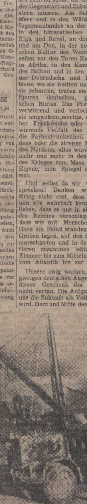
Kurze Rast unserer Gebirgsjäger während eines Spähtruppenunternehmens in Süditalien

während eines Spähtruppenunternehmens in Süditalien