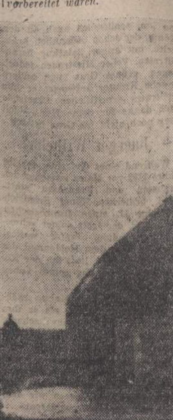
Kurze Rast unserer Gebirgsjäger während eines Spähtruppenunternehmens in Süditalien

während eines Spähtruppenunternehmens in Süditalien