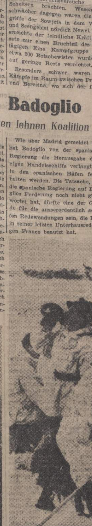
In einem Hafen dicht hinter der deutschen Kampffront in Italien wird Kohle geladet