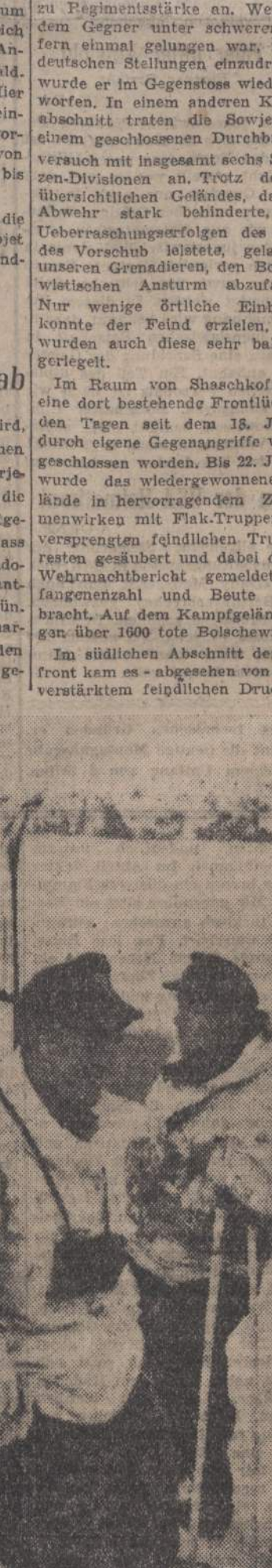
Kurze Rast unserer Gebirgsjäger während eines Spähtruppenunternehmens in Süditalien

während eines Spähtruppenunternehmens in Süditalien