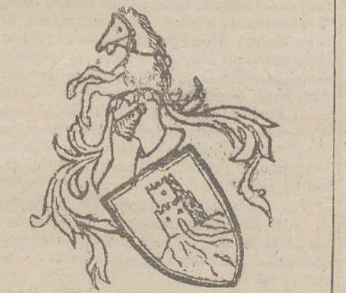
Lo stemma di Artegna.

Quello però che Artegna non ottenne dei suoi antichi padroni, il diritto di erigersi a Municipalità, lo ebbe da Napoleone, e