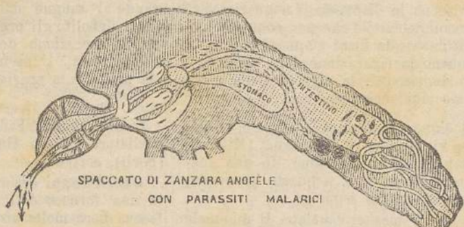
SPACCATO DI ZANZARA ANOFELE CON PARASSITI MALARICI

Formula dell'illustre Clinico Prof. GUIDO BACCELLI