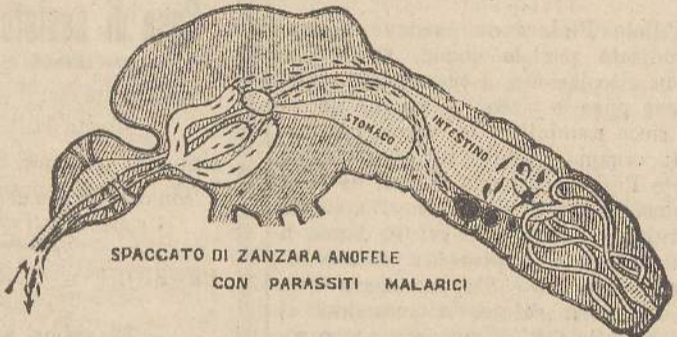
SPACCATO DI ZANZARA ANOFELE CON PARASSITI MALARICI

Formula dell'illustre Clinico Prof. GUIDO BACCELLI