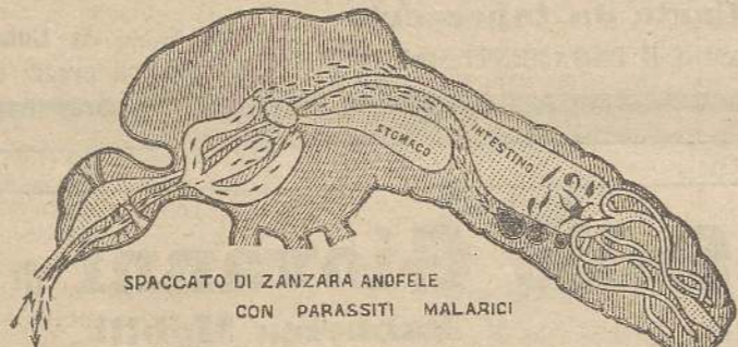
SPACCATO DI ZANZARA ANOFELE CON PARASSITI MALARICI

Formula dell'illustre Clinico Prof. GUIDO BACCELLI