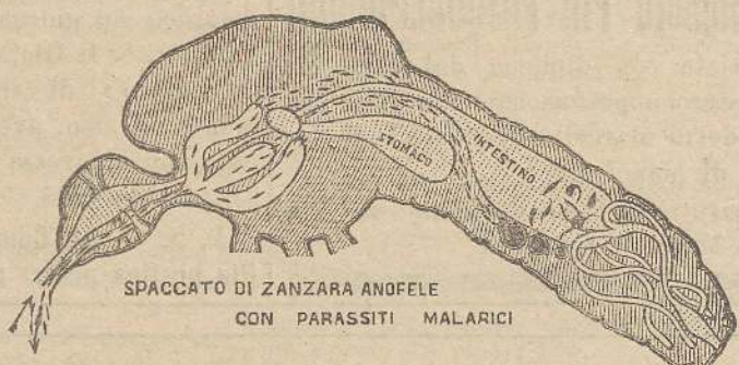
SPACCATO DI ZANZARA ANOFELE CON PARASSITI MALARICI

Formula dell'illustre Clinico Prof. GUIDO BACCELLI