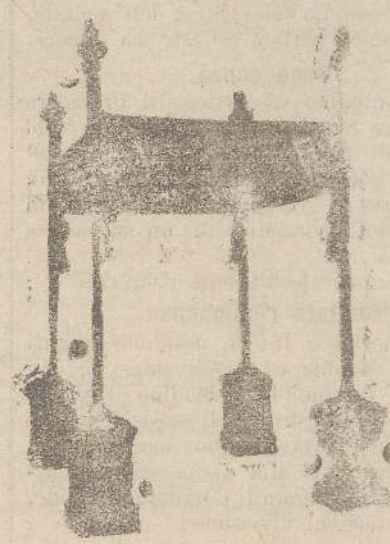
Baldacchini L. 150