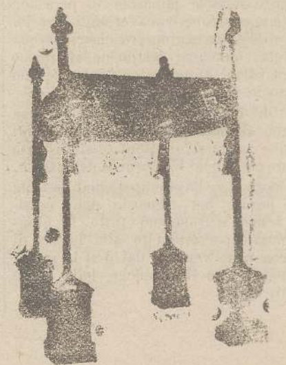
Baldacchini L. 150