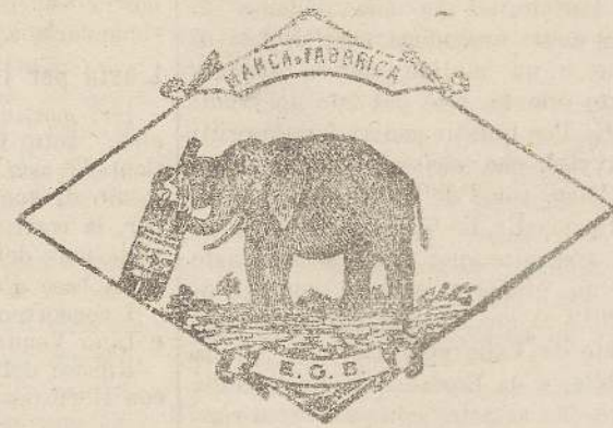
Marcas speciale depositata.

Valenti autorità mediche lo dichiarano il più efficace ed il migliore ricostituente tonico digestivo dei preparati consimili, perchè la presenza del RABARBARO, oltre d'attivare una buona digestione, impedisce anche la stitichezza originata dal solo FERRO-CHINA.