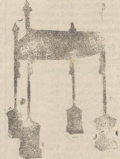
Baldacchini L. 150