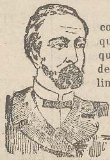
PRIMA DELLA CURA