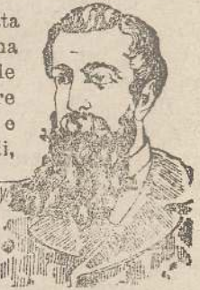
DOPO LA CURA

L'Acqua CHININA-MIGONE , preparata con sistema speciale e con materie di primissima qualità, possiede le migliori virtù terapeutiche, le quali soltanto sono un possente e tenace rigeneratore del sistema capillare. Essa è un liquido rinfrescante e limpido ed interamente composto di sostanze vegetali, non cambia il colore dei capelli e ne impedisce la caduta prematura. Essa ha dato risultati immediati e soddisfacentissimi anche quando la caduta giornaliera dei capelli era fortissima. Tutti coloro che hanno i capelli sani e folti dovrebbero pure usare l'Acqua CHININA-MIGONE e così evitare il pericolo della eventuale caduta di essi e di vederli imbianchirsi. Una sola applicazione rimuove la forfora e dà ai capelli un magnifico lustro.