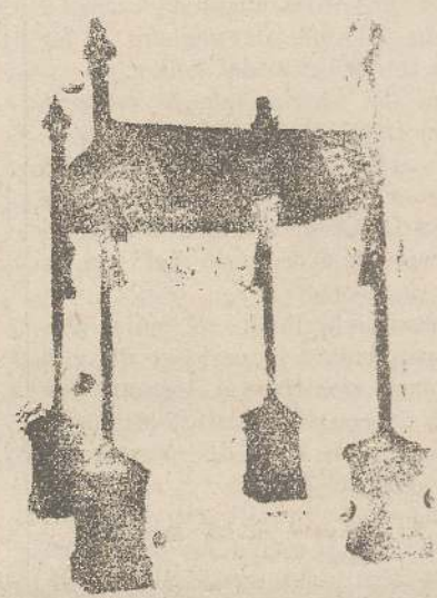
Baldacchini L. 150