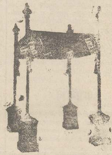
Baldacchini L. 150