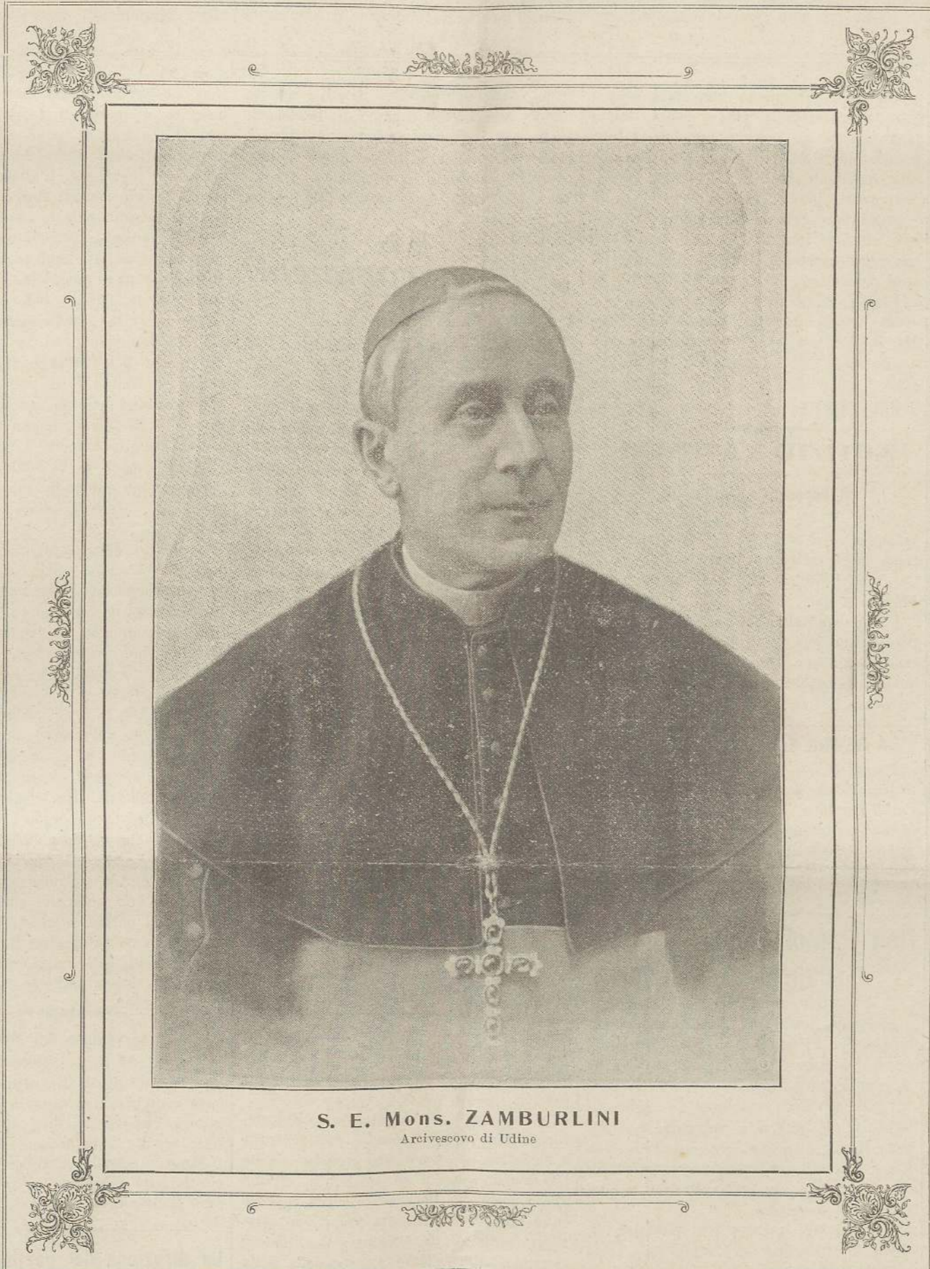
S. E. Mons. ZAMBURLINI Arcivescovo di Udine

che l'Amministrazione non valeva a mantenere coi meschini introiti. Dall'altra parte il cuore buono dello Zamburlini vedeva tanti giovani di condizione agiata, che non trovavano un luogo sicuro di educazione, le cui famiglie dovevano ri-