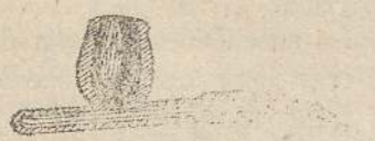
Pipa Magicienne Brevettata

Depositi di tele incerate - Veli per duratti - Reti metalliche per stacchi