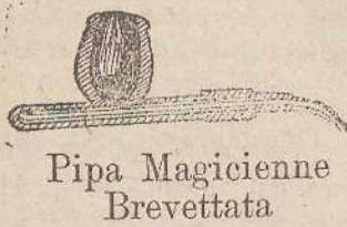
Pipa Magicienne Brevettata