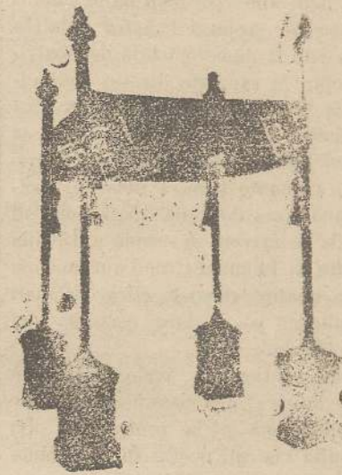
Baldacchi L. 150

Apparamenti completi, Pianete, Stole, Veli Omerali, Abiti da Vergine, Veli ricamati, sul Thul in seta e oro, Copripisside, Ombrelle per Viatico, Stratti mortuari, Parapetti altare, Tappeti per coro Padiglioni per altare in seta, bourrette e coto - Cingoli, Merli candidi per camici e coto - Colonnami seta in tutte le altezze, Broccati, Damaschi, Grisette, Frangie, Galloni, Tocche, Stelle, fiocchi oro, seta e argento, Cordoni, Tele filo Rosa per confraternite.