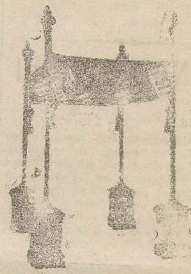
Baidacchi L. 150