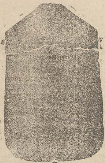
Pianeta seta L. 24