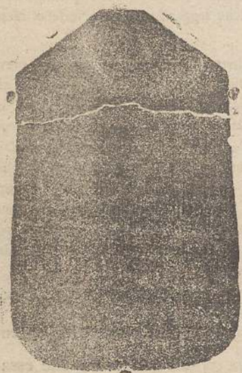
Pianeta seta L. 24